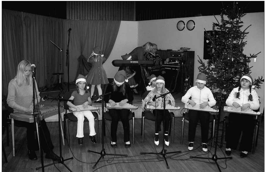
● Esinevad Viiratsi rahvamaja kandleringi õpilased.