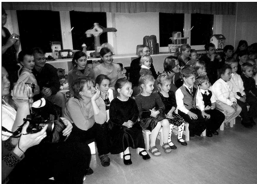
• Uusna Lasteaia pere jälgib Tänassilma rahvamaja näiteringi etendust.