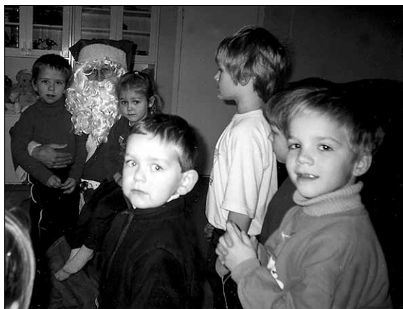
• Pisimad Uusna Lasteaia lapsed on süles ja suuremad seisavad salmi lugemise järjekorras.

Lasteaia enda jõulupidu oli lõbus ja meeolukas. Külla oli tulnud Tänassilma rahvamaja näitering, kes esitas lõbusa näidendi koos päkapikkude ja metsamooriga. See lugu meeldis ka isadele ja emadele.