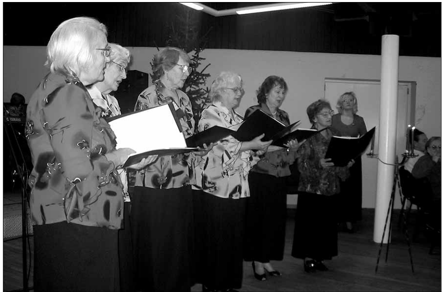
● "Kanarbiku" laulu saatel süüdati jõuluküünlad.