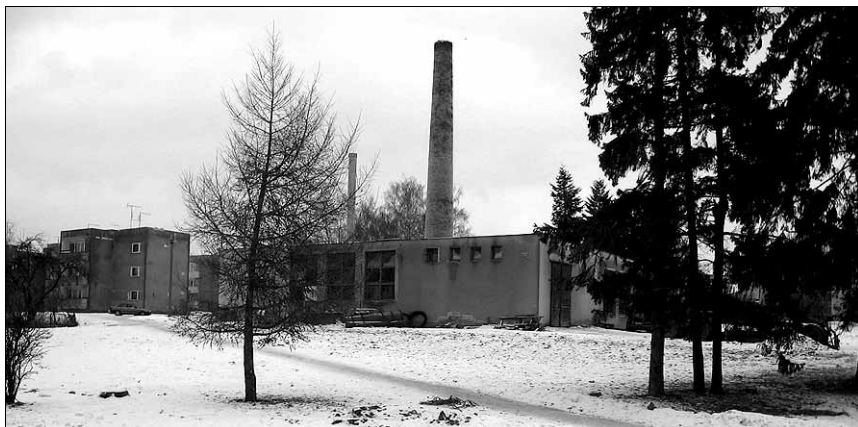
● 2007. aastal võib sellel kohal paikneda kaubamaja.