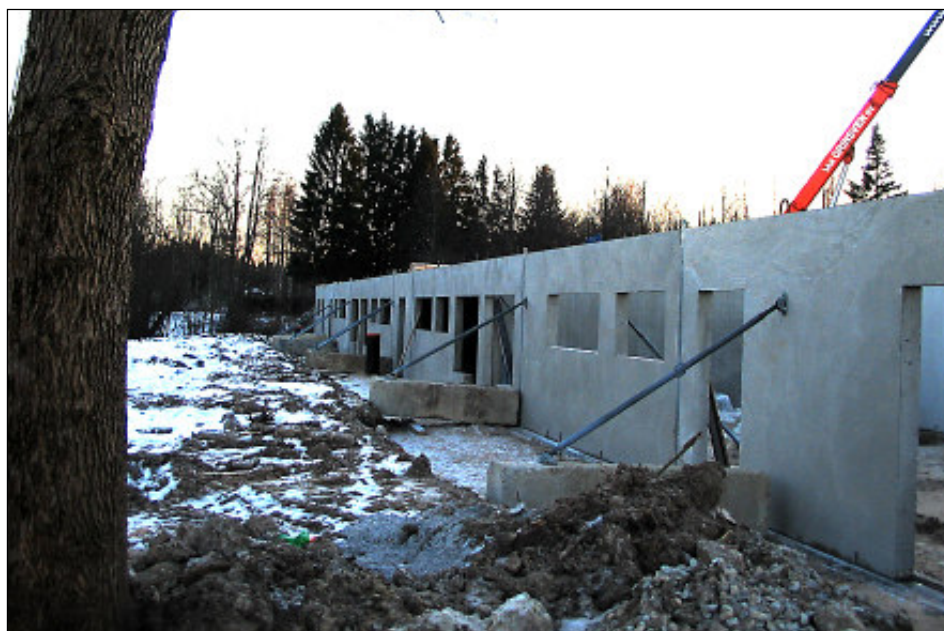
53 korteriga elamu Pärnade puisteel ootab elanikke juba sellel aastal

Viimane korterelamu Paikuse valla territooriumil valmis 12 aastat tagasi aadressil Kooli tee 11. 2005. aastal sai valmis Põllu tänav 2 kaheksakohaline ridaelamu. Praktiliselt kogu vahepealse aja on Paikusele ehitatud ühepereelamuid. Nüüd tundub, et tulekul on korrusmajade ehitamise aeg.