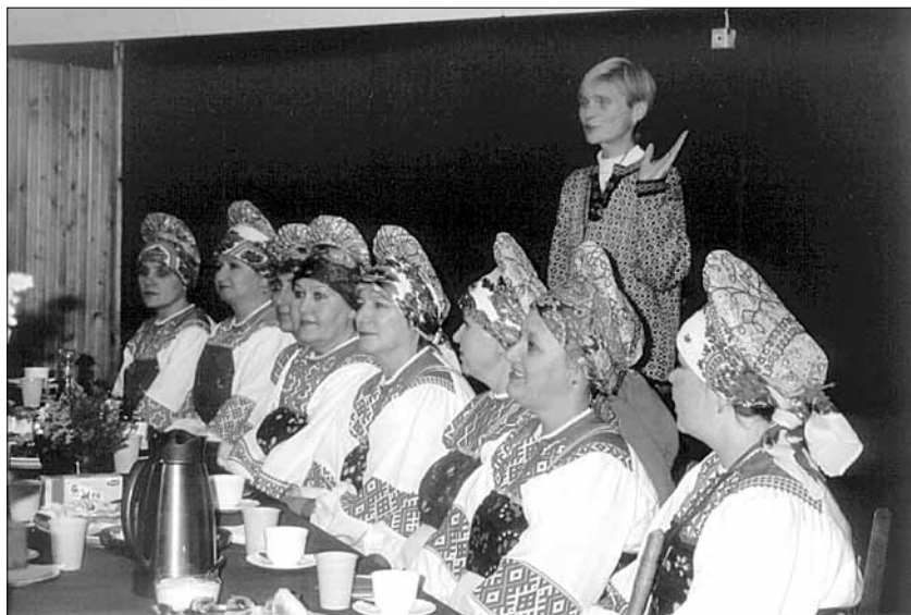
● Uhked ja värvikad need Komi naised!

Meie elust-olust olid külalised vaimustunud. Neid üllatas kõik, sest kuuldu põhjal on seal tegemist väga vähe edasi arenenud kandiga. Seda nii majanduslikult kui sotsiaalselt. Markantseim lugu räägitust on sotsiaaltoetus-tega, mida esiteks ei anna meie "soo-