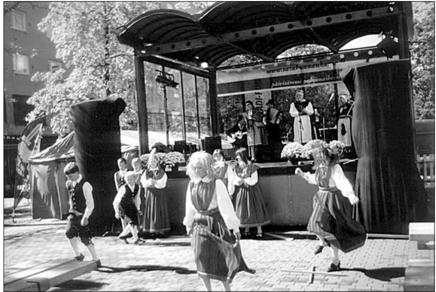
● “Õunake” esitab Pori Folgi peakontserdil kepitantsu.

Viiratsi Rahvamajas on endised raamatukogu ruumid. Sinna peaks saama Avatud Noortekeskus. Selleks on vaja üht entusiasti, noorsootöötajat, kes leiaks tööks vahendeid ja raha. Ta peaks olema valla palgal.