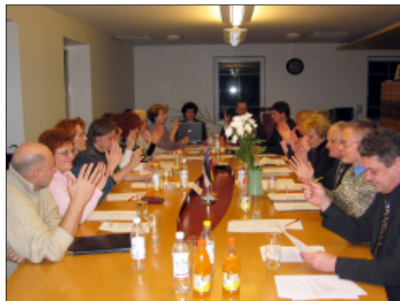
Tapa linnavolikogu hääletas 17. novembril üksmeelselt ühinemislepingu koostamise poolt.