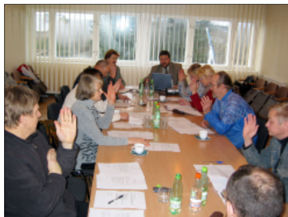
Lehtse vallavolikogu liikmed otsustasid 17. novembril toetada ühinemislepingu koostamist.