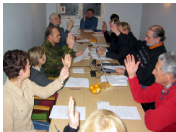
Saksi vallavolikogu kõik liikmed tötsid 17. novembril kää ühinemislepingu koostamise alustamise poolt.