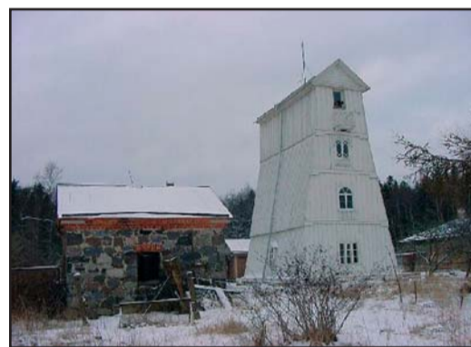
Puittuletorne tuleks lugeda ajutisteks

ehitisteks. Säilinud on 1892. a ehitatud Käsmu puittuletorn, mis kuulub Käsmu meremuuseumi kompleksi. 1896. a ehitatud Kunda puittuletorn hävis tulekahjus 1999. a suvel.