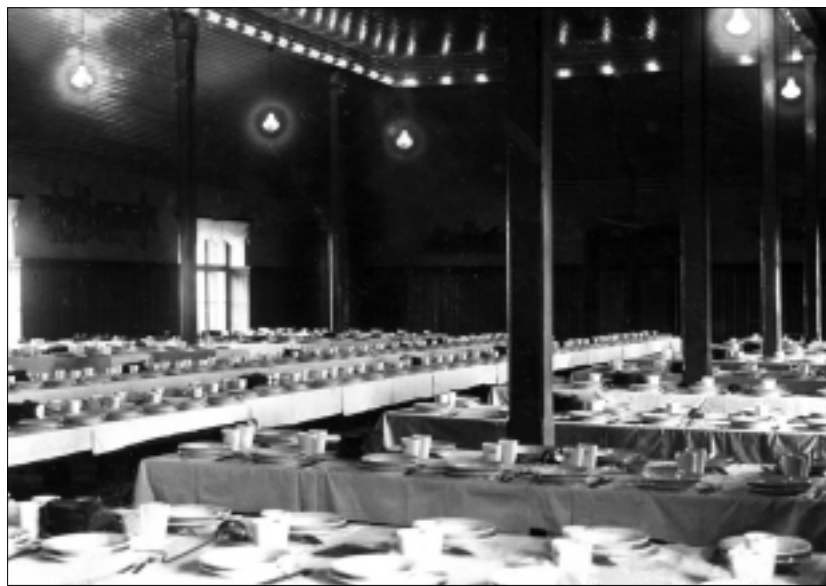
Vaade soomusrongirügemendi sööklasse.