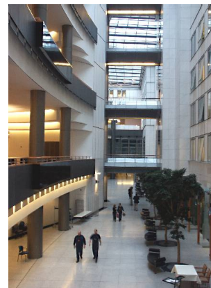
Brüsselis asuva Europarla- mendi sisevaade

“Loota, et hollandase välja mõeldud direktiiv soosib Ida-Euroopa ettevõtjaid, ei ole just päris adekvaatne maailmanägemus”