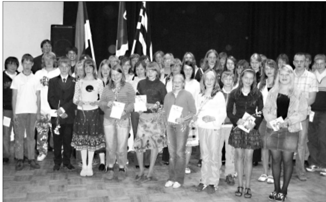
Vallavalitsus tunnustas sel teisipäeval kultuurikojas olümpiaadidel edukalt esinenud õpilasi.