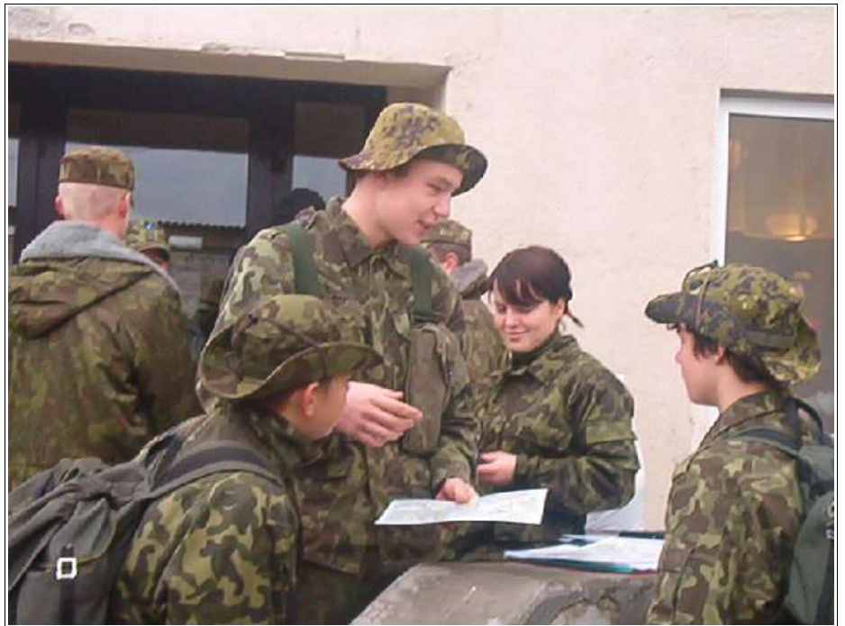
Võidukad Järvakandi noorkotkad