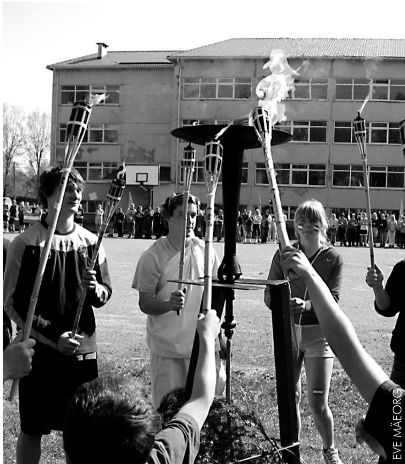
Puka keskkooli olümpiamängude tuli süttib.

Mängudel oli vastavalt vanusele kavas 8 huvitavat spordiala. Lendava taldriku vise, tossu viskamine ja ta-