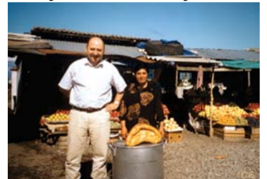
Puuviljapiirkondades olid puuviljalettide read pea kilomeetripikkused.