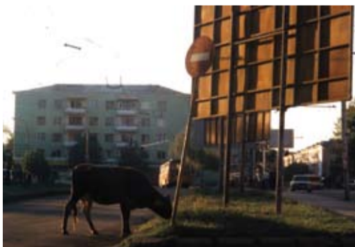
Lehm linnatänaval pole mingi erand

Näha oli seda, et tänavad ja majad olid suhteliselt räsitud olekus, kuid juba tehakse neid korda. Pilt provintsis võrreldes pealinnaga on siiski erinev. Pealinna on tulnud välisinvesteeringud, seda on näha tänavapildis. Zugdidi ja Kutaisis on pilt selline, et kõikjal jalutavad lehmad, sead, koerad, kõikidel nendel loomadel on kindlasti olemas peremees ja kui ma küsisin, et kuidas need loomad omanikuni jõuavad, siis mulle öeldi väga lihtsalt, et kõik lehmad ja sead tulevad õhtuks koju tagasi. Nii et see polnud mingi erand, et keset linna sõi lehm või sead jooksid ringi.