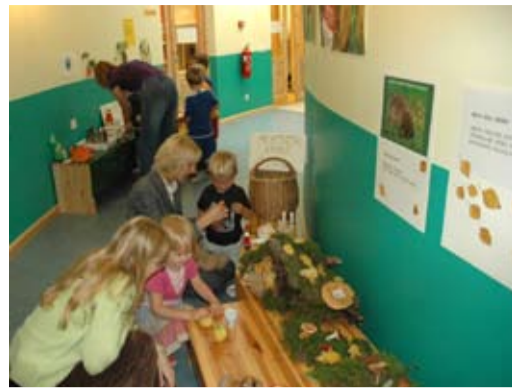
Sügisnautusel sai ise kõike avastada, teha, tunda, kuulda ja katsuda.

Kas me mäletame veel, kuidas maitseb kõrvits-samoos, lõhnab kannuseen, krudiseb kapsas riivimisel ja värske pohlamari põses haputab? Seda ja veel palju muud said Rannamõisa Lasteaia lapsed teada 25. septembri interaktiivsel sügisnautusel, mille käigus lapsed TAJUSID, kuidas sügis maitseb, lõhnab, krudiseb, katsudes tundub ja pakatab.