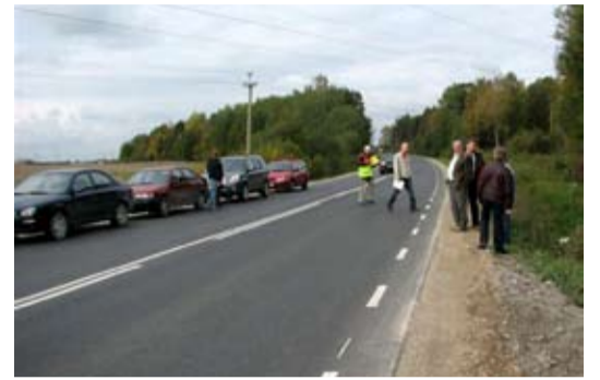
Ühine komisjon võttis objekti vastu 12. oktoobril