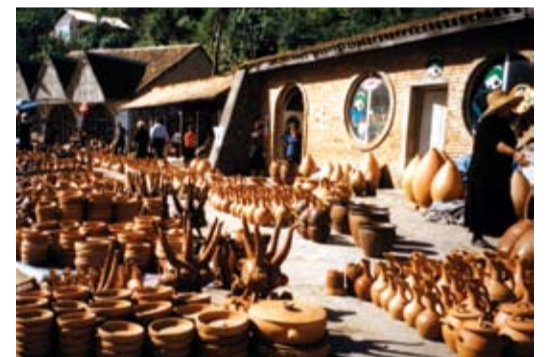
Käsitööalad on jaotunud piirkonniti – mõnes külas tegeldakse ainult keraamikaga.

Teel oli näha hästi palju külasid, kus inimesed tegelevad ühe või teise käsitööalaga. See on paikkonniti väga erinev, nt paikkonnas, kus on võimalik teha savist veininõusid, kaussid, tassid, siis need külad ainult sellega tegelevadki ja müüvad tee ääres keraamikad. Need külad, kes olid väga hästi ära õppinud leivategemise, ainult sellega tegelevadki ja tee ääres ei ole mitte ainult üks või kaks leivamüüjat, vaid neid on kümneid kahel pool teed. Mõnes teises külas tehti käsitööd, punutisi, puutööd.