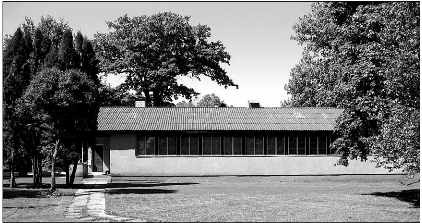
● Viljandi Elu Sõna Kogudusele kuuluv kinnistu aadressiga Lastekodu 2.

Valmas tehakse sel suvel korda infopunkti ümbrus.