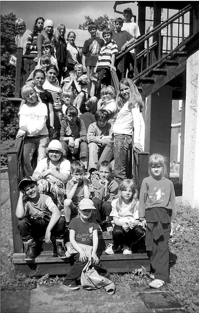
● 2005. aasta ööpäevalaager jõudis oma matkal Öissu.