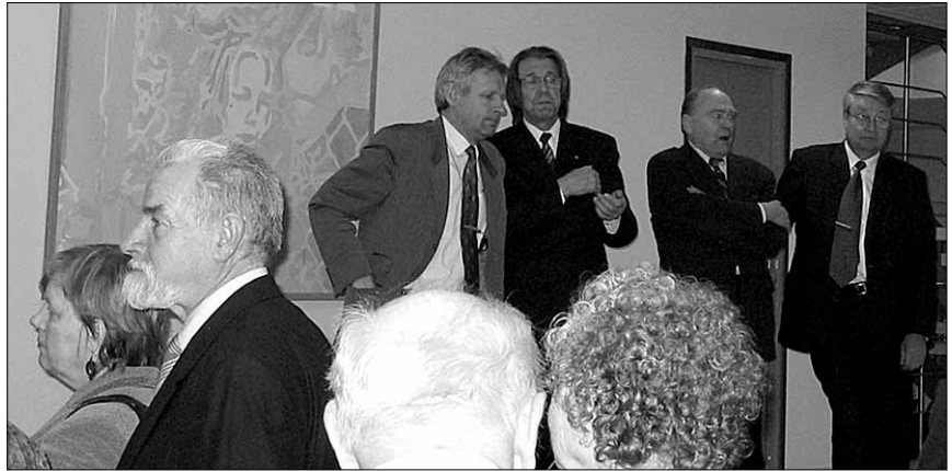
• Tartus peetud teaduskonverentsil käis elav arutelu ühistegevuse teemal.

Maal on rikkuse ema. Mõistujutt: Tartus Tähtvere pargis käib igal hommikul üks mees oma kaht koera jalutamas. Tal on see võimalus oma õuel. Miks ta