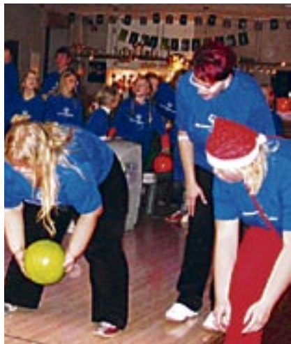
Üks võistleb, kaks anavad hoogu!

“Edasiseks soovime, et jätkuksid arutelud klassides, koolides, küll võistlustest, küll meie erivajadustega lastest. Et see teema jõuaks perekonnaõpetuse programmi ja seisaks ka ülikooli programmis. Me oleme ju kõik inimesed siin Inimeste Maal - sellest peaksimest mõtlema ja selle nimel tegutsema.”