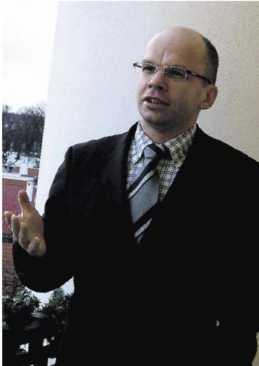
Õiguskantsler Allar Jõksi hinnangul on koostöö riigi ja kolmanda sektori vahel paljuski formaalne.

Jah, Eestis on küllaltki raske olla väljaspool erakonda poliitiliselt aktiivne. On ju erakonda luua Eestis tunduvalt raskem kui ülejäänud Euroopas. Kui siia lisada veel fakt, et erakondade maine on Eestis väga madal, siis jõuame selleni, et valimistel väheneb osalemise aktiivsus. Kui inimesed ei saa valida valimisliitude poolt, üksikkandidaadi poolt aga üldjuhul pole mõtet häält anda, siis jääbki ainult võimalus valida erakonda. Paraku ei meeldi see võimalus paljudele valijatele. Seetõttu võib järgmistel kohalikel valimistel prognoosida valimisaktiivsuse langust. Samas pole Eesti erakonnad mingid massiparteid, mistõttu rääkimine ainult erakondlikest valimistest on vastutustundetu. Ei saa kahe silma vahele jätta ka teiste riikide praktikad. Euroopas on vaid kolm-neli riiki, kus kohalikel valimistel on lubatud kandideerida ainult erakondadel. Nendes riikides pole aga kohalikud omavalitsused võrreldavad oma suuruse poolest meie omadega. Samas on erakonna loomise tingimused neis riikides tunduvalt kergemad, kohati pole vaja erakonna moodustamiseks isegi liikmete miinimumarvu. Terves