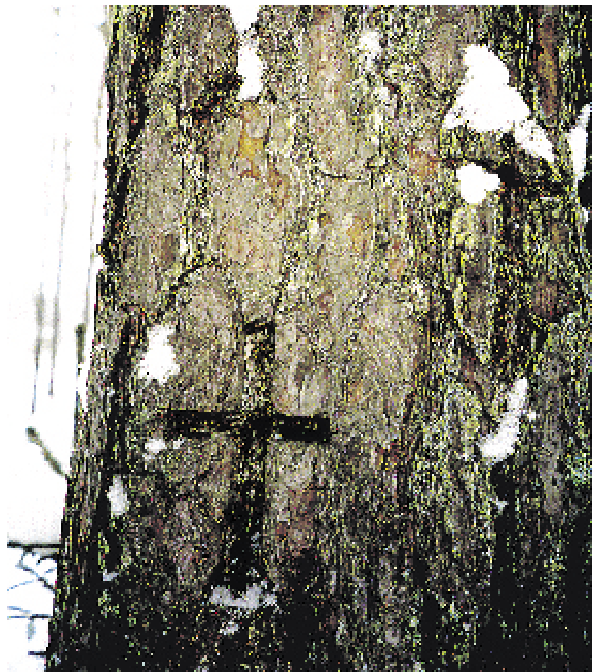
Võrumaal võib ristipuid veel näha Saru lauatehase lähedal.

«Hiite ja teiste kultuuripärandi looduslike vormide, sealhulgas ristipuude kaitse on väga keeruline valdkond,» nendib Muinsuskaitseameti peadirektori kohusetäitja Agne Trummal. «Mõisapargid, hiied, ristimetsad on elavad organismid ja pidevas muutumises. Loomulikult on neid võimalik kaitsta, aga kuna see on interdistsiplinaar-