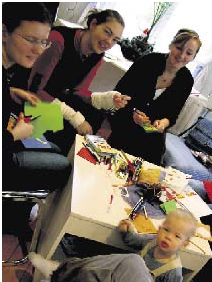
Tartu vabatahtlikud valmistavad eelmiste jõulude ajal koos Tartu Kristliku Kodu lastega jõulukaarte.