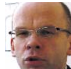
Allar Jõks õiguskantsler

Eestis on küllaltki raske olla väljaspool erakonda poliitiliselt aktiivne.