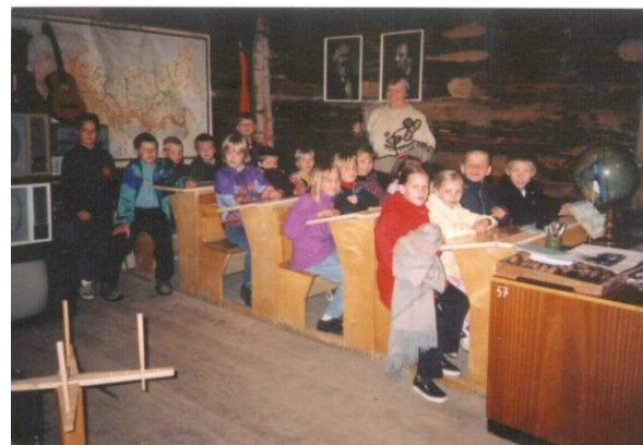
Lapsed kooli muuseumis ajalootundi pidamas