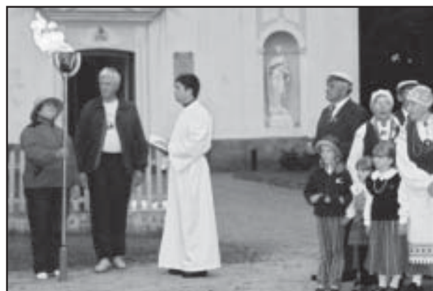
Laulupeotuli jõudis ometi ka Röpina!