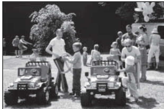
Vaidlused emmedega: kes roolib