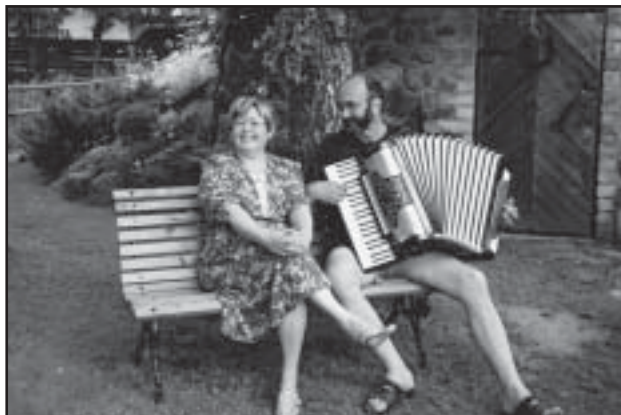
Mängin ainult sulle ...