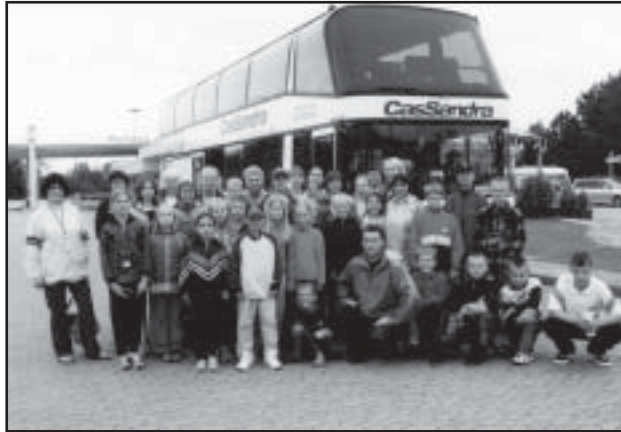
Naha kooli reisiseltskond. Fahrenkrugini on jäänud ainult 30 km.

Koolimaja õu oli täis võõrustajaid ja väikeste tervituste järel sõideti juba varem planeeritud peredesse. Kõige vähem oli peredes üks meie laps, kõige rohkem kolm. Jaotuse tegid fahrenheitlased ise, kuid eelnevalt konsulteeriti ka meiega. Kuna see oli meie rahvale esimene nii pikk ja samuti esimene rahvusvaheline reis, siis oli kaasas ka rohkesti täiskasvanuid.