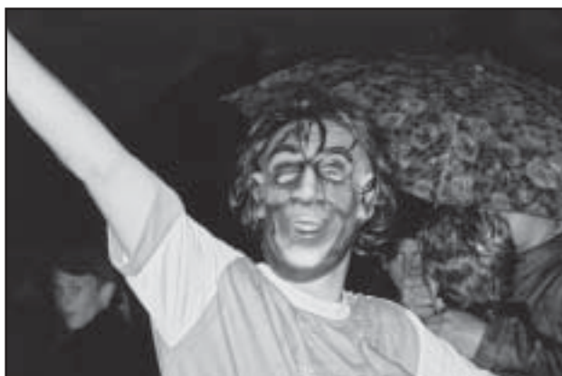
Pildista mind! Tänavareiv