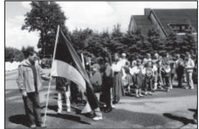
Tunnise rongkäigus marssimise vahel tehti 15 min paus (esiplaani Naha Algkooli delegatsioon).

Päev, mis ei unune meie lastel vist iial, saabus 21 juunil – terve päev lõbustuspargis atraktsioonidel, mida mõned nägid esimest korda elus. Sakslaste poolt oli see väga targalt seatud esmaspäevale, kus külalstajaid vähem ja meie päralt oli kõik seal pakutav terve päeva jooksul. Söögid ja joogid olid korraldajatel kaasa võetud. Igaüks sai sellel päeval lõbu niipalju kui suutis võtta.