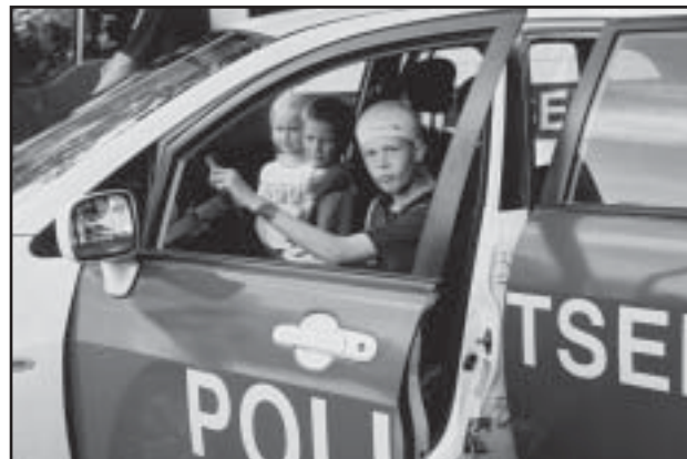
Tead, täitsa politseiniku tunne tuleb peale, kas näost ei paista?