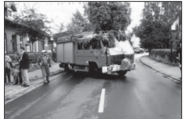
Üks tuletõrjeauto kandis Põlva maakonna vappi, tähistamas seda, et sealt oli esindus nende suvepeol.

23 juunil toimus kolme bussiga sõit Põhjamere äärde, kus oli ette nähtud pool päeva veeta mudameres mütates ja merevee tõusu ja mõõna vaadates. See jäi aga väga lühikeseks suure vihmavalangu tõttu. Julgemad proovisid lühikeseks aja jooksul ka mudas mütamise ära. Põhjamere äärsedel aladel hoiavad looduslikud liigniisked alad korras väga suured lambakarjad. Muuks sealne viljatu maa ei sobi. Suure meremaailmaga tutvumise osalisteks saime meremuuseumis.