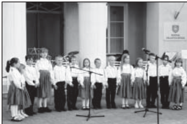
"Vikerkaar" lapsed Röpina päevade avamisel esinemas