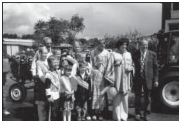
Viis kuningapaari. Paremalt teine – Kindervogelschiesseni organisatsiooni esimees.