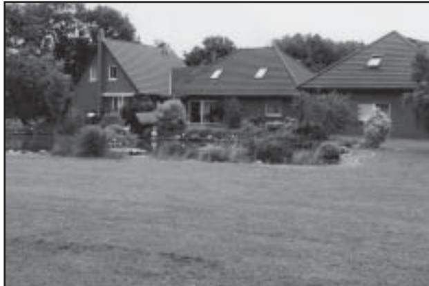
Iga Fahrenkrugi külas asuv maja on oma hoolitsetud ümbruse ja lillerohkusega vaatamisväärsus omaette.

Nüüd siis sealveedetud päevade tegevustest lähemalt. Meie ei läinud sinna lullil lööma, vaid õppima – nii keelt, kultuuri, laiendama oma silmaringi. Saama uusi kogemusi, oskust elada, oskust hinnata väärtusi. Nägime, mida peab üks inimene tegema, et väärtusi luua, neid hoida, kaitsta ja teistega jagada. Kõike seda kogesime nende Fahrenkrugis veedetud päevade jooksul. Esimese päeva õhtupoolikul viidi lapsed ratsutama, kus osalesid juba võõrustajad pered ise.