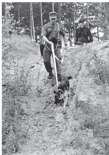
Saatse kordoni koerajuhit jälgis ajamas.