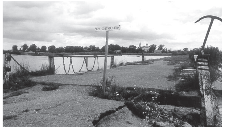
Eesti-Vene kontrolljoonest poolitatud teetamm taga asuva Kulje küla kohal kattus taevaskeskpäevaks paksult pilvedega.