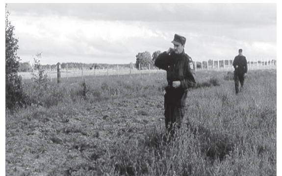
...ja õhtusel ringkäigul kordoni vastutusala raskeimal piirilõigul.