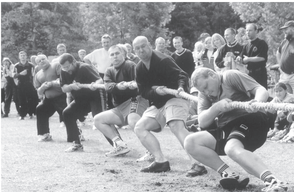
MURDMATUD: Põhja musklimehed võitsid kõik alagrupi vastased ning alistasid poolfinaalis Narva-Jõesuu. Ka mullustel võitjatel – saarlastel – ei õnnestunud neid mehi finaalis üle mängida.