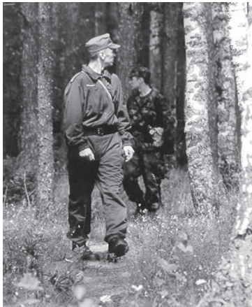
Väraska kordoni patrull kurikuulas "Saatse saapas" tähelepanelikult ümbrust uurimas.