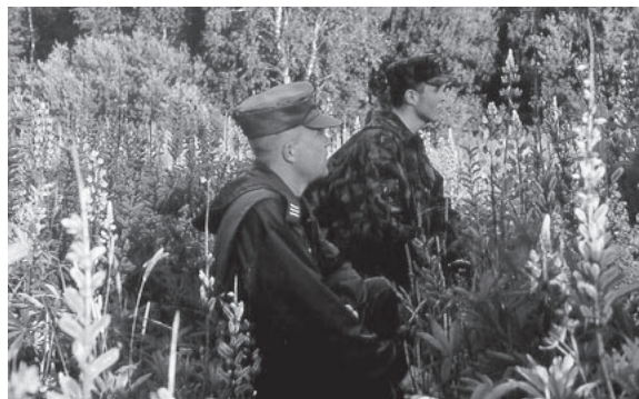
Piusa kordoni patrull varitsuses....