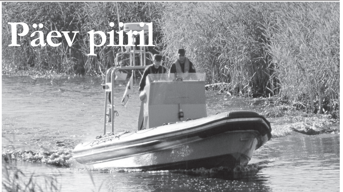
Peipsi äärses Varnja kordoni toimikond naaseb varahommikusest patrullretkelt, selja taga äsjatõusnud päikeses sädelev järv.