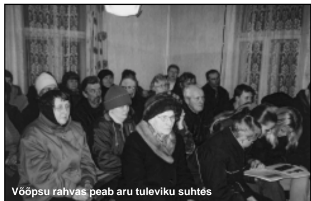
Võõpsu rahvas peab aru tuleviku suhtes