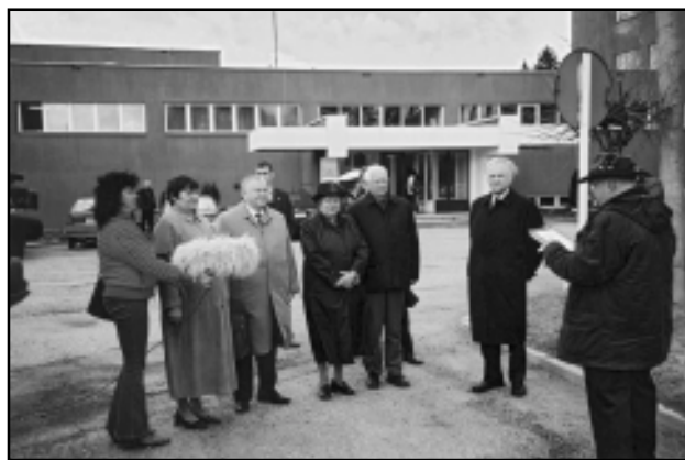
Räpina saab metsapealinna tunnistuse

Koostöö looduskaitsetega: osa looduskaitsejaid on ennast vastandanud metsameestele ja talitavad väärtalt. Metsamehed on alati auga rohelist mundrit kandnud.