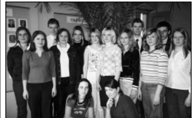
Räpina ÜG Õpilasmavalitsus