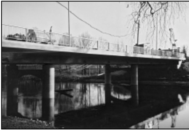
Rápina uus sild võtab ilmet

Välisvalgustuse postide kaabli, elektri- ja sidekaabli kanalite monoliitimine sillal kavatakse teha aprilli lõpus- mai alguses. Aprillis alustatakse ka teetöid, AS Põlva Teed tasandab mullet ja nõlvu. Mais paigaldab OÜ Enerel 10 kw elektri- ja tänavavalgustuse. Sidekaabli paigaldab AS Connecto. Ja lõpupeole – juunis