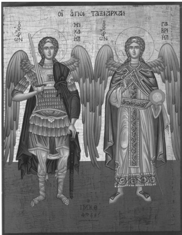
Peainglite Miikaeli, Kaabrieli, Raafaeli ja kõikide ilmihuta vägede püha 8. november

Patutunnistust võetakse vastu reedeti alates kella 18.30st ja preestriga kokkulepitud ajal.