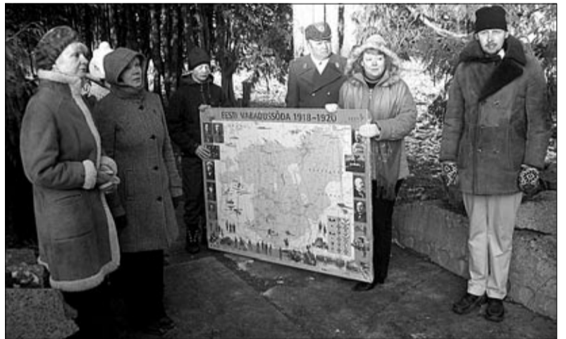
● Aktusel Vabadussõjas langenute mälestussamba juures anti Halliste koolile üle Vabadussõja-teemaline illustreeritud Eesti kaart.