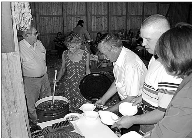
● Kalurite päeval Valmas