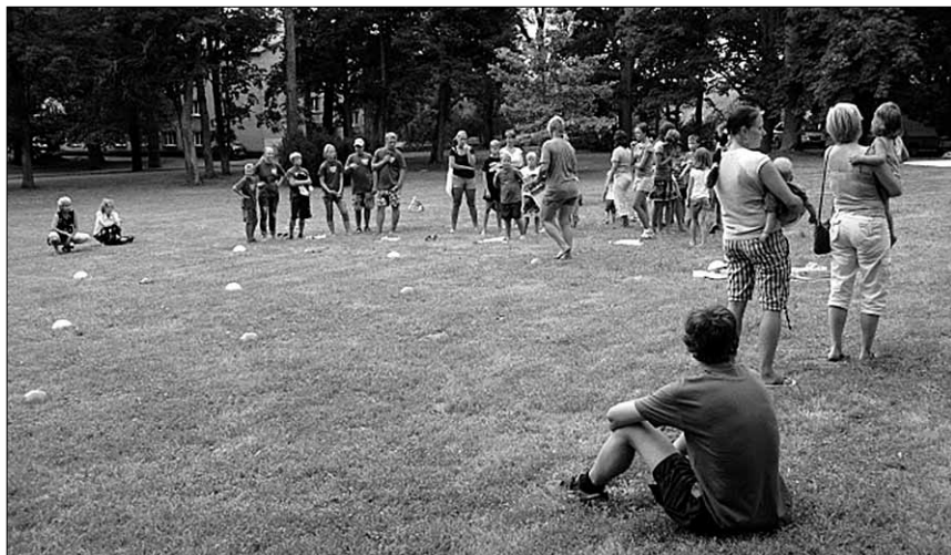
● Palju põnevust pakkus teatevõistlus.