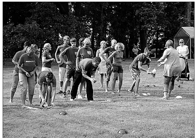
● Külade päeval Valmas