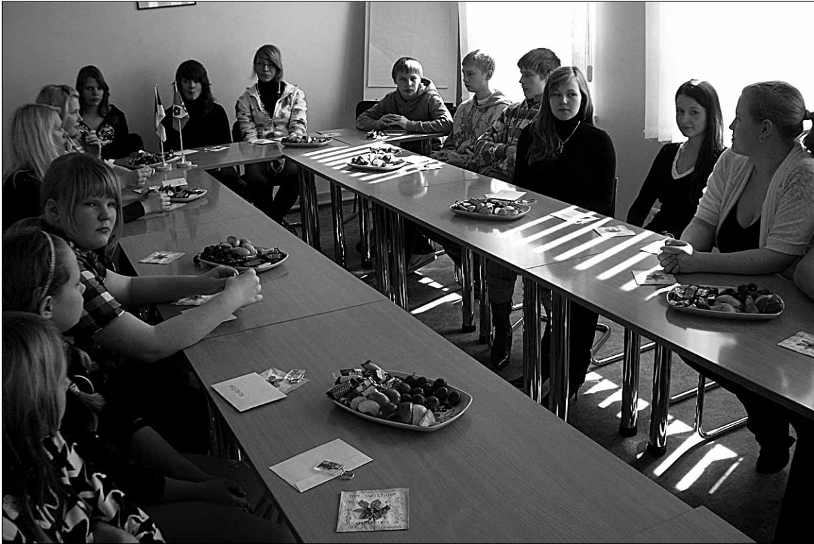
● Abja Gümnaasiumi head lapsed pidulikul vastuvõtul vallamajas.