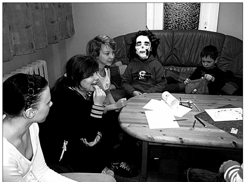
● Kinobussi tuuril Kamarale pakkus lastele küllaga põnevust ja nalja süzee väljamõtlemine lühioodufilmile, mida saab vaadata Abja noortetuba koduleheküljelt.