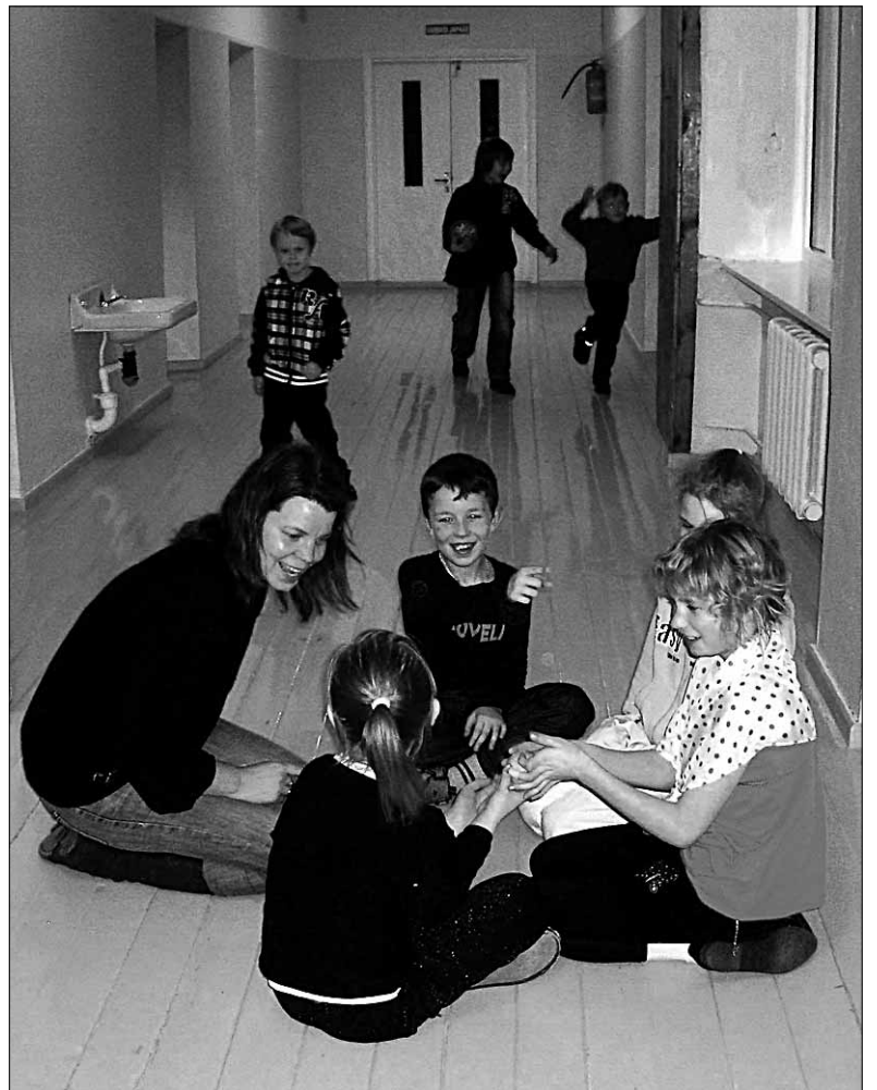
● Mõisaküla Koolis korraldatavatel laste ja lastevanemate ühisõhtutel saavad lapsed täiskasvanute juhendamisel meisterdada, mängida ja liikuda.