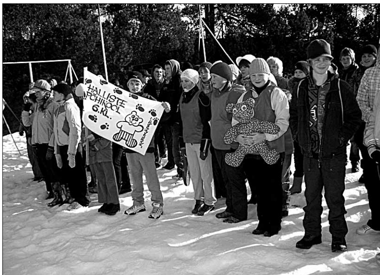
• Tänavuse Abja Gümnaasiumi maastikumängu "Keeristorm" külalises sead löi kaasa ka Halliste Põhikooli VI klassi võistkond "Karukäpad" (keskel).