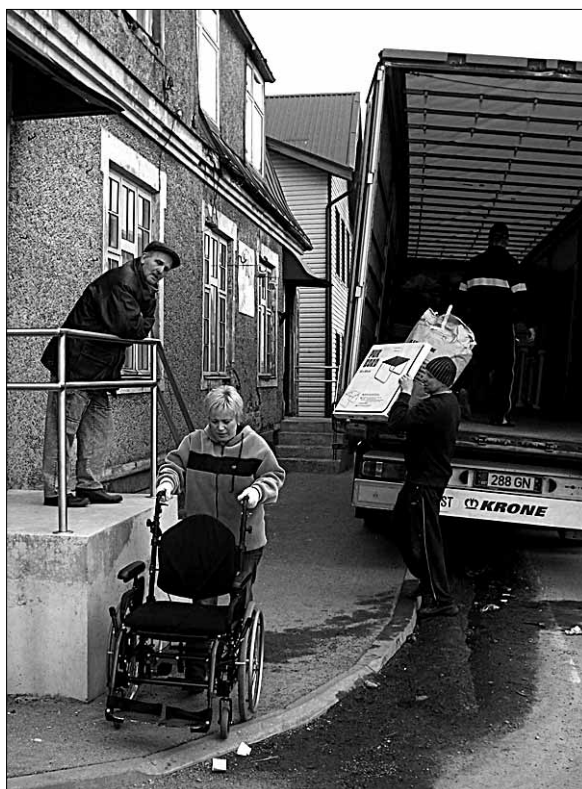
● EKNK Abja-Paluoja koguduse sõbrad Taanist saatsid abjalastele heategevusliku abisaadetisena hinnalisi haiglavoodeid, ratastoole ja palju muud vajalikku.