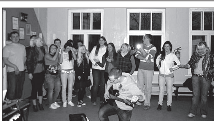
• Noortekeskuse aktiiv esineb Valgas.