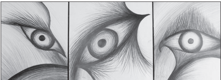
MARLEEN KIVIMETS 2009 (grafiit)

Karksi Noorte Kunstistuudio võtab vastu uusi õpilasi reedel, 12. juunil ja laupäeval, 13. juunil kella 12—16. Info 5649 0889. Are Haab.