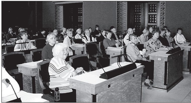
• Võimalus istuda Riigikogus.