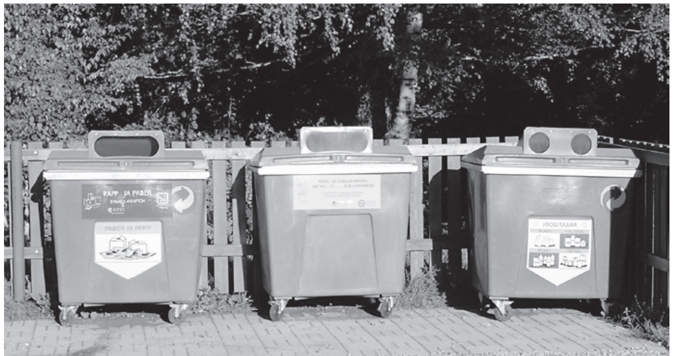
Kellel nüüd enam huvi prügi sorteerida, kui iga kuu peab nõutud koguse prügi tekitama?