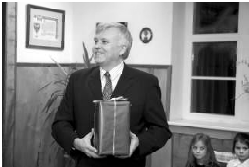
Siseminister Jüri Pihl

Jõelähtme vallavalitsus on külarahvaga ühel meelel, et ainsaks vastuvõetavaks väljapääsuks praegusest olukorrast on uue Neeme