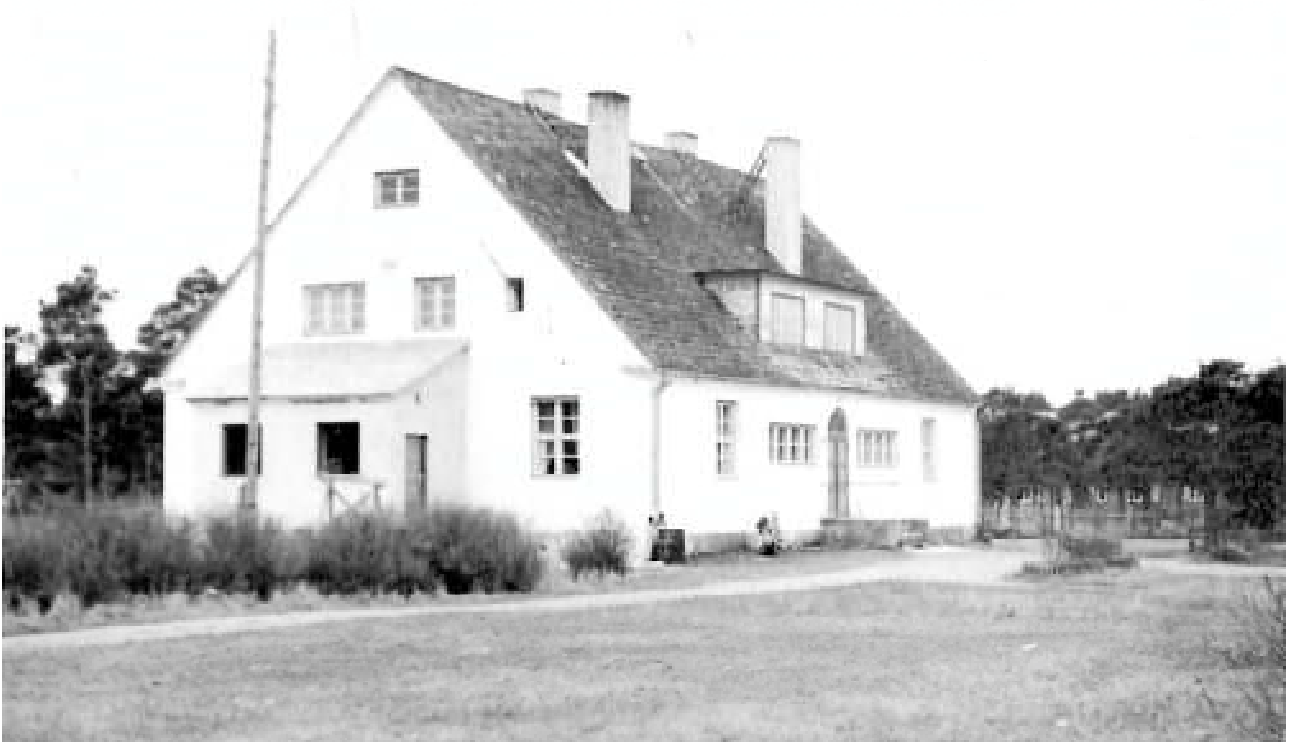
Neeme koolimaja enne renoveerimist.