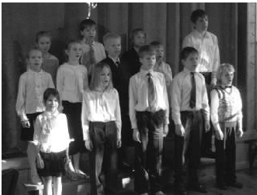
Neeme Algkooli õpilased