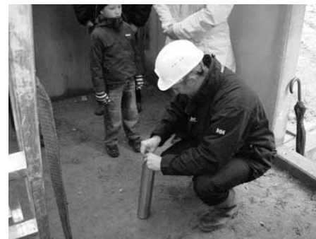
Silindri sulgemine nurgakivi panekul