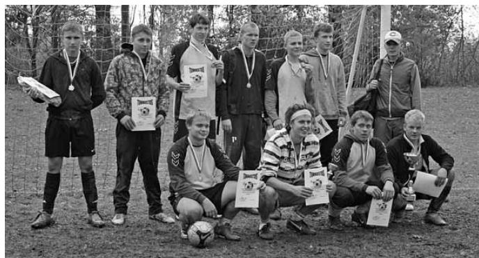
Külaliiga võitja JK Ummistus