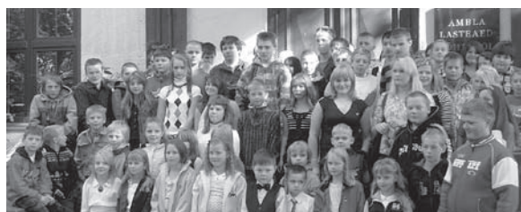
Ambla Lasteaed-Põhikooli pere esimesel koolipäeval