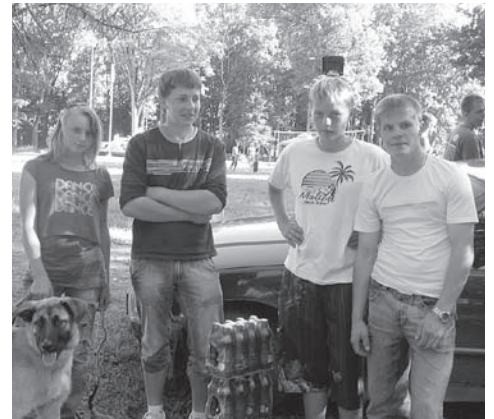
Kiigelandi kiikujad Kõpus

SK Vabariigi Võllimees 127 punkti, SK Valma-Tamme 37 punkti, MTÜ Kiigeland 37 punkti, Metsavenna Talu 23 punkti, Saaremaa Kiigesport 20 punkti.