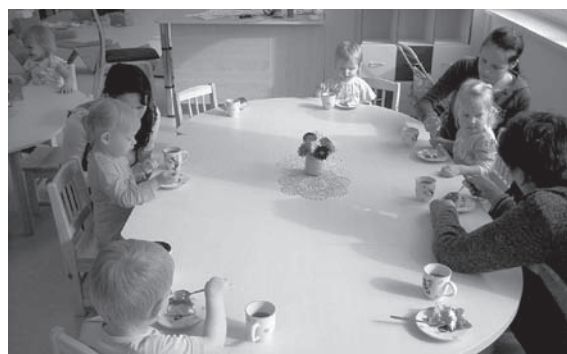
Lapsed ja vanemad torti söömas

TÄNAVU ALUSTAVAD OMA KOOLITEED I KLASSIS