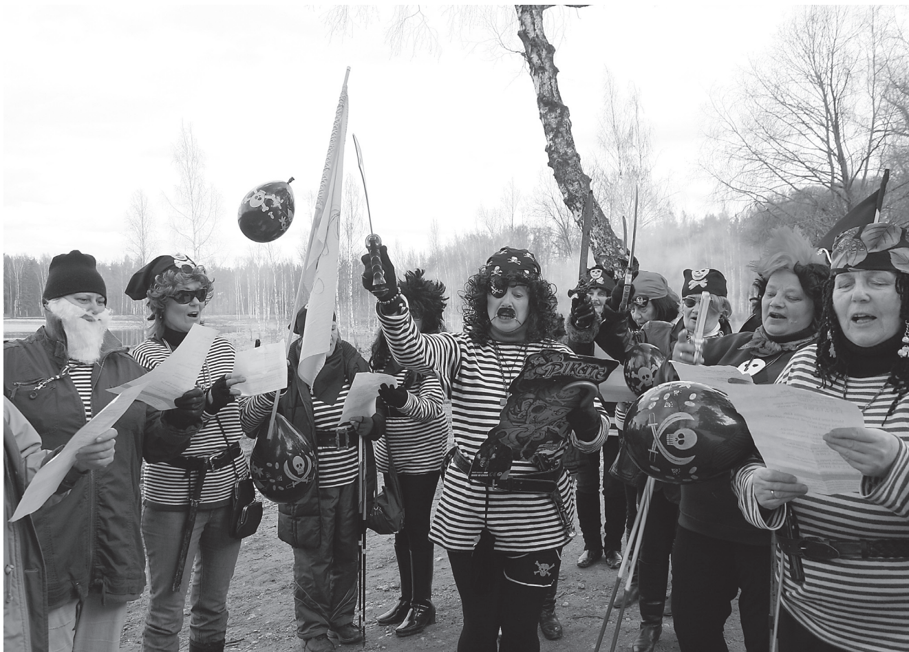
Röövli laulu lauldes tõmbasid Arbi järve mereröövliid võõlt mööga, olid valmis võitluseks. "Piraat ära väsi lainete voos, anna mulle püstol, lähme üheskoos!" kõlas Arbi järve kaldal.