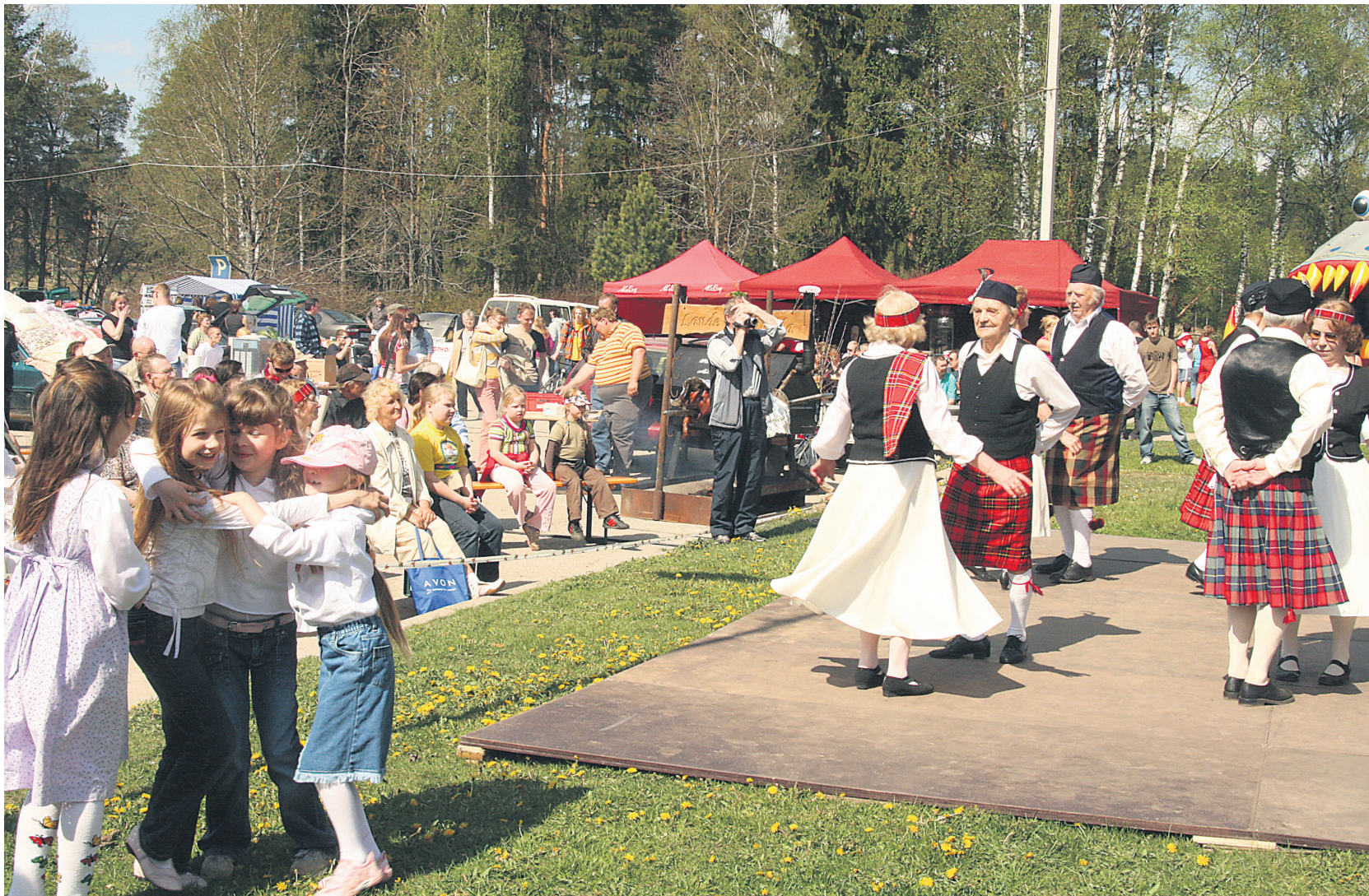
Kui Elva kodukandipäeva on toimunud ühel päeval ja seda on soosinud ilus ilm, on see alati toonud Elva kesklinna üsna palju rahvast. Fotomeenus aastast 2008.