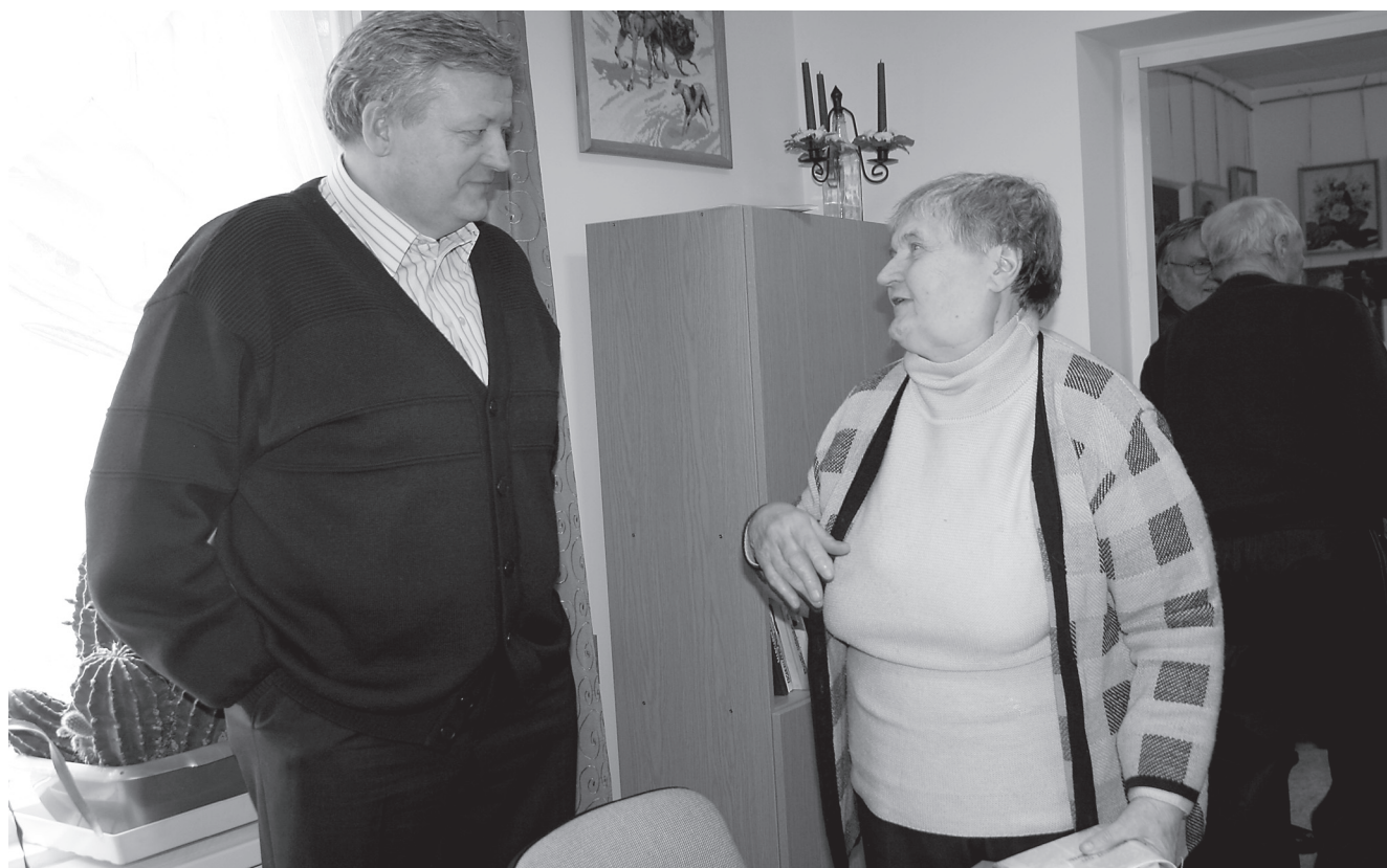
Peep Aru sai Asta Luksepaga hää jutusoone peale.