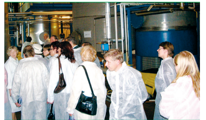
Ettevõtlusnädala raames toimunud üritused olid publikurohked. Pildil külastavad huvilised Weroli rapsiõlitehast.