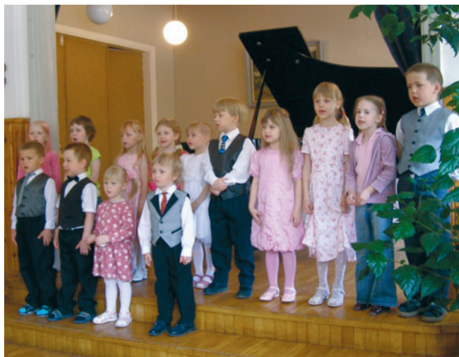
Laulu-mängukooli lapsed emadepäeval esinemas.

Üks vahva võimalus on tuua laps muusika juurde. Isegi kui esialgu tundub, et teie järeltulijal puuduvad muusikalised eeldused, on siiski tore, kui ta