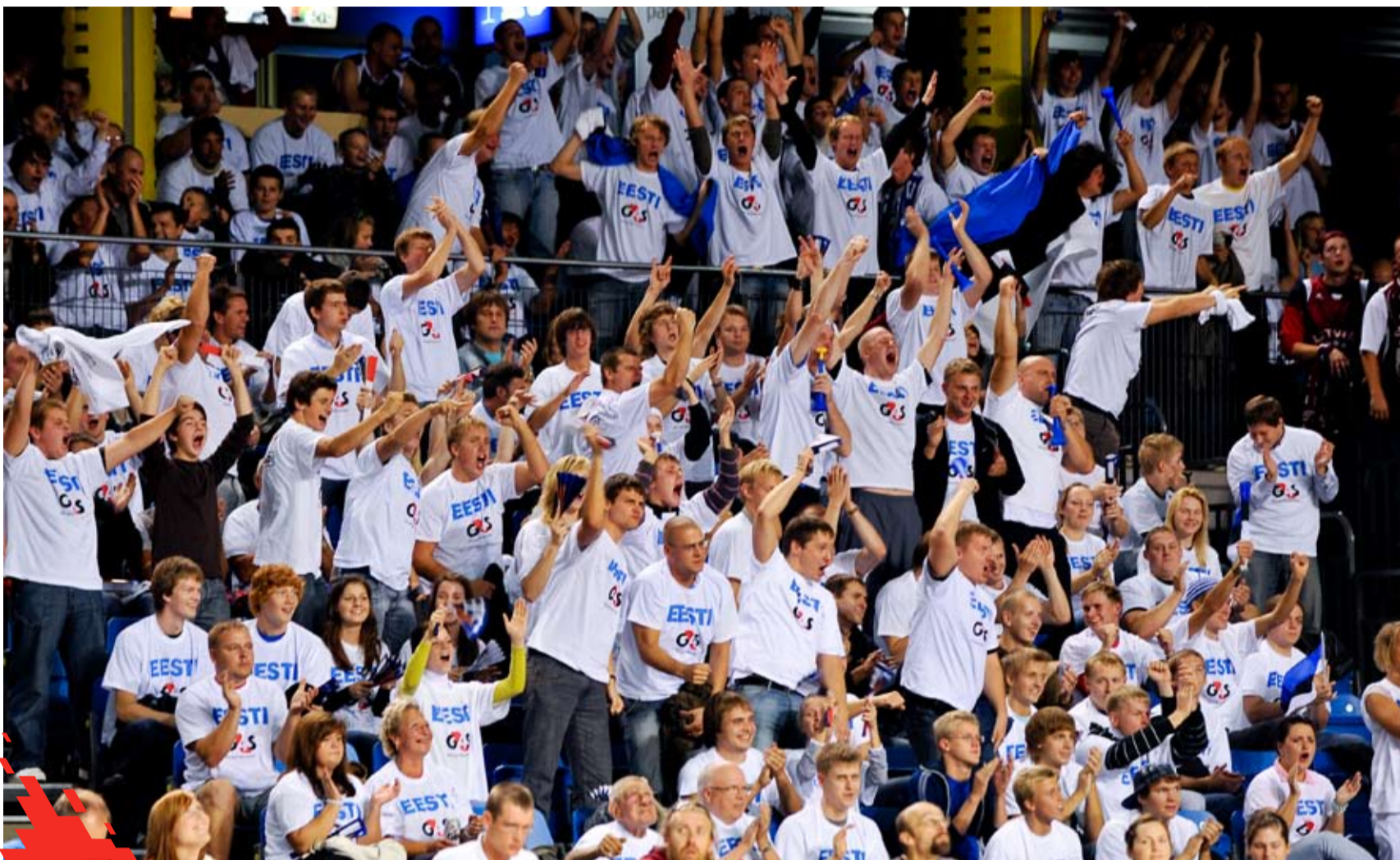
G4S aitab Eesti korvpallipublikule meeldejäävaid elamusi pakkuda ka kolmel järgneval hooajal.