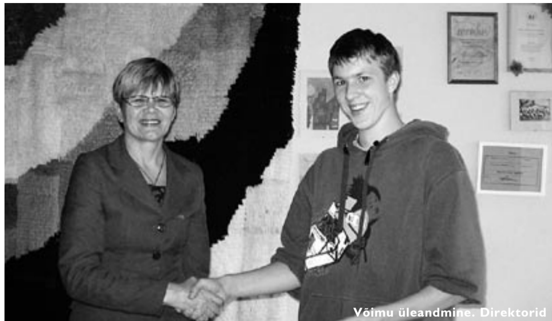
Võimu üleandmine. Direktorid