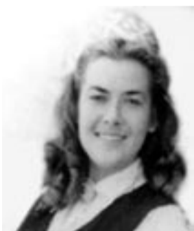
Foto aastast 1948.

Ajast, mil noorusromantika oli kuritegu (loe ka eelmisest Otepää Teatajast)