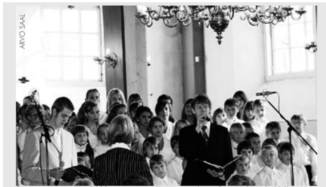
Otepää gümnaasiumi 100. aastapäeva kontsert toimus Otepää Maarja kirikus.