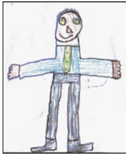
Meie kooli direktor

Toredast vestlusest direktoriga süüvis minusse teadmine, et me koos moodustame ühtse ja üks-teist mõistva kollektiivi. Meie intervjuu lõpus ütles direktor väga mõjuvad sõnad: ”Ei ole meie aega. Ei ole teie aega. On meie ühine aeg.”