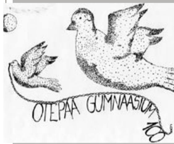
9b klass, SIGNE ILVES