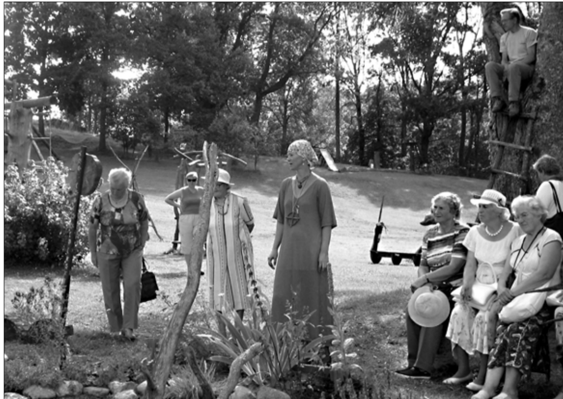
Lehtse Käsitöö Seltsingu eestvedamisel ja KOP-i projekti rahastamisel käis bussitais Tapa valla inimesi Lõuna-Eestis Metsamoori Perepargiga tutvumas. Reisist lähemalt saab lugeda 2. lk-lt.