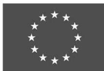
Toetab Euroopa Liit