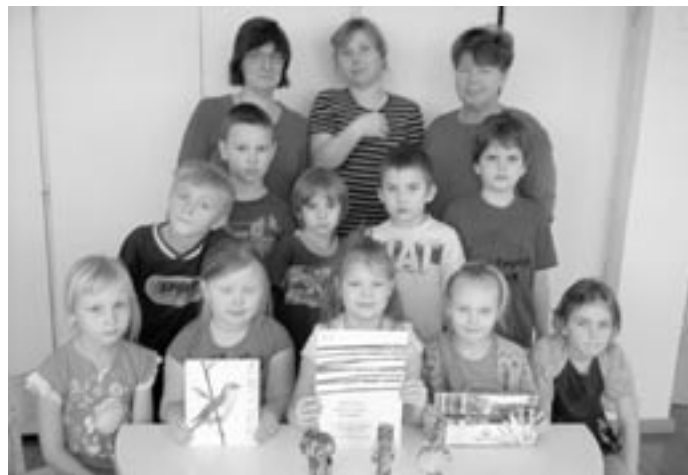
Tänukirja saanud koolieelikud oma auhindade ja juhendajatega