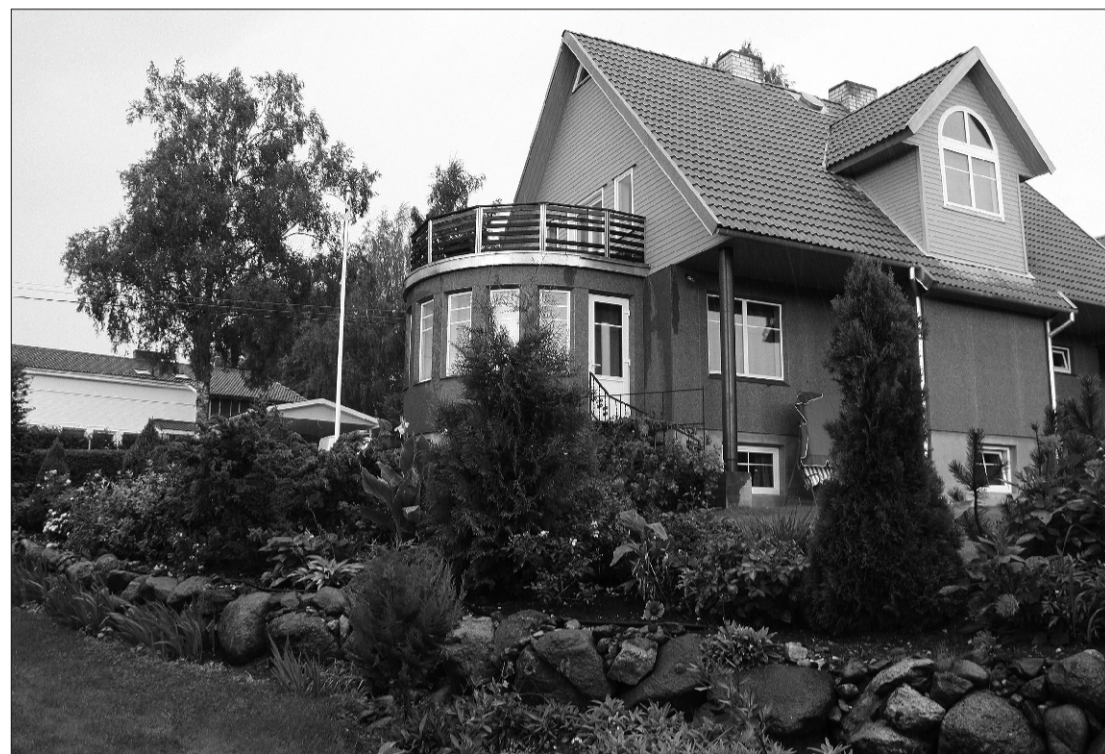
◀ Ringpuiestee 16A