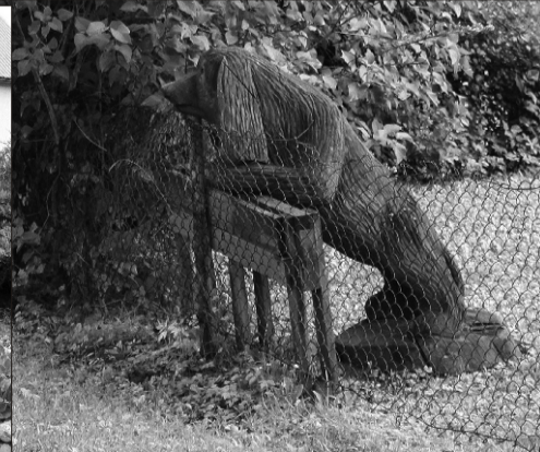
◊ Detailid Jaama tänav 9 eramu juures