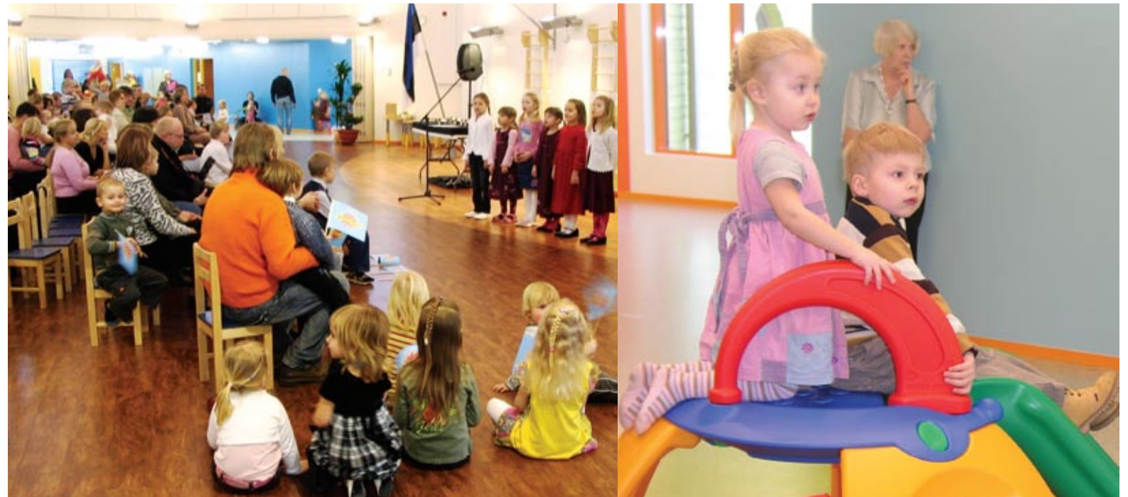
Valgusküllasest ja hubasest lasteaiast saab teine kodu 144 lapsele.