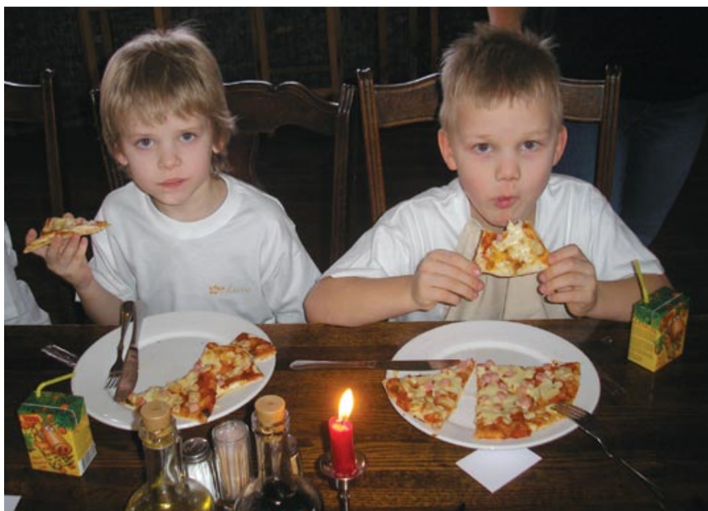
Tibutare väikesed pitsameistrid endavalmistatud hõrgutisi maitsmas.