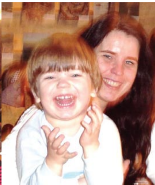
Lugu haaras ka kõige pisemaid kuulajaid.