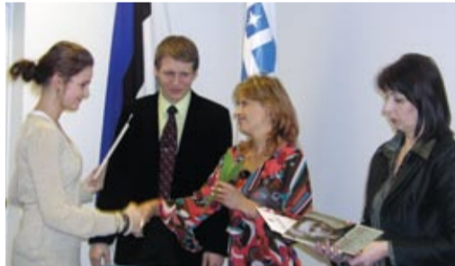
Vallavanema vastuvõtule olid kutsutud TUG 6.-12. klasside parimad.

Õpilastel oli volikogu saalis toimunud vastuvõtul võimalik ka endil volikogu istung läbi teha ja tähtsaid otsuseid vastu võtta. Nii hääletas õpilastevolikogu hääletage 26 poolt, 8 vastu ja 1 erapooletu valda eakate hooldekodu rajamise poolt.