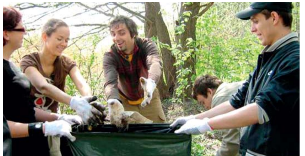
Harkujärve koristusteam tööhoos.