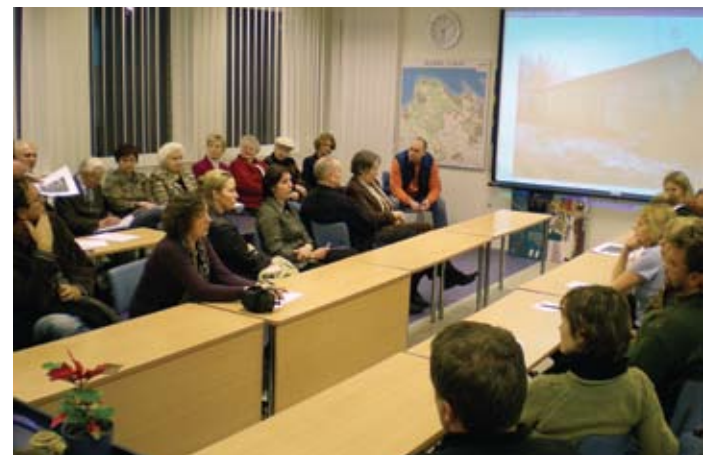
Üksmeelele jõuti pargi korraldamise vajaduses ning et alale sobivad valla muuseum ja noortekeskuse laiendus töökodadega käeliseks tegevuseks.