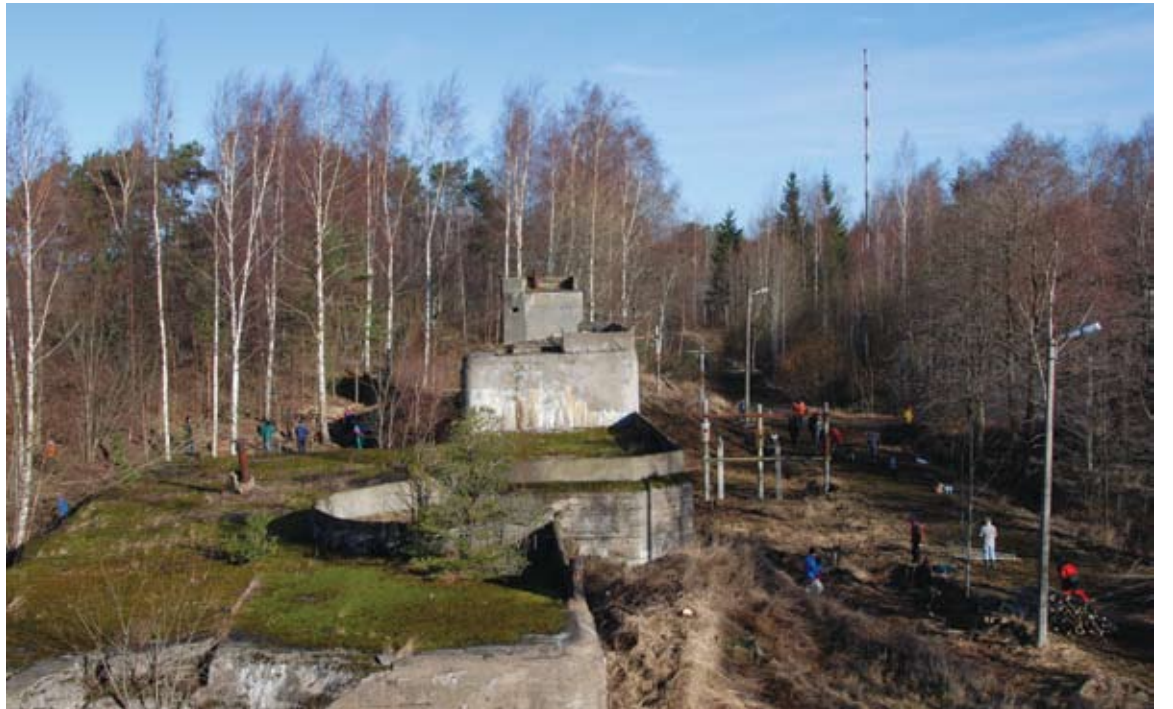
Patarei ümbrus puhastati võsast.

Talguliste sees peitus tohutu energia ja töötahe, mille tulemusena oli töö juba kella