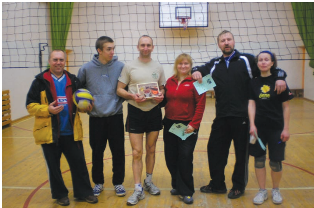
Harku valla meistrid Türisalu Spordiklubist.