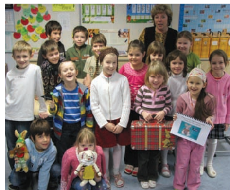
I b kl. Felixi ja Jutaga