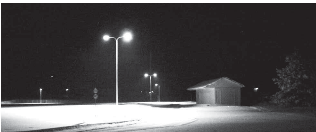
Puka staadionil on avatud valgustatud suusarada kuhu on oodatud kõik suusahuvilised.