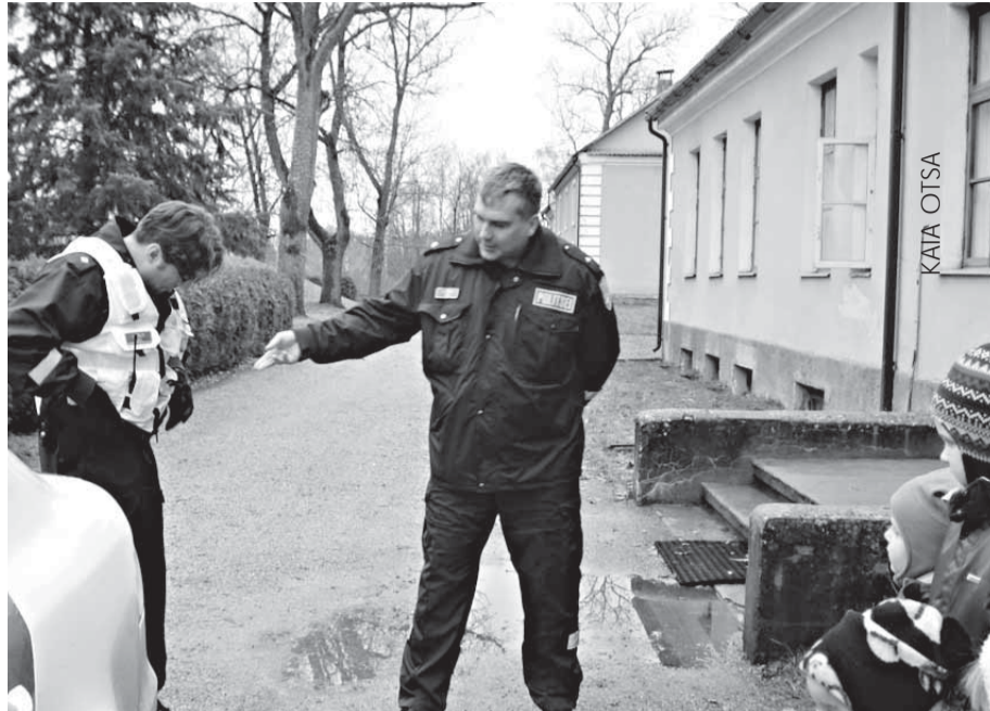
Politseiniku elukutse on nii huvitav!