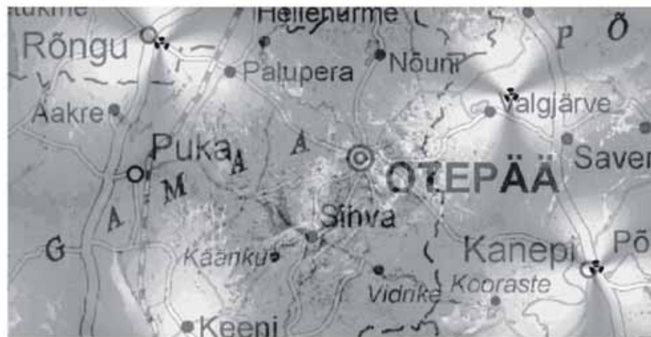
○ väga hea levi ● hea levi ● keskmine levi

Eesti Energia tütarfirma Televõrgu AS on pidevalt investeerinud KÕU teenuse kvaliteedi parandamisse seoses klientide arvu jõudsa kasvuga. Otepää vald on üks neid kohti, kus KÕU levala on peamiselt tasemel "hea" (vt. levala kaarti)