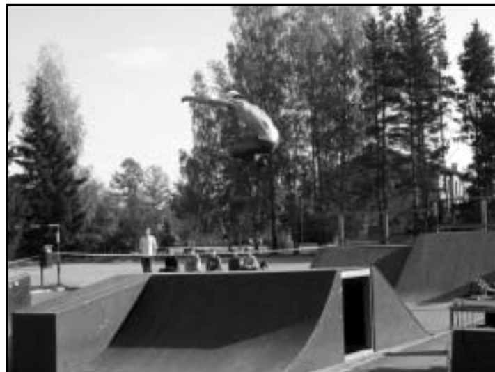
Raigo - grab 360 flyboxist.