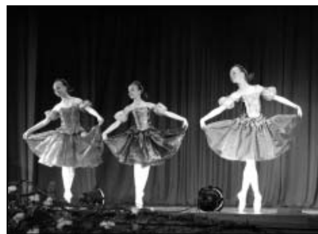
Esinevad Ida Tantsukooli õpilased.