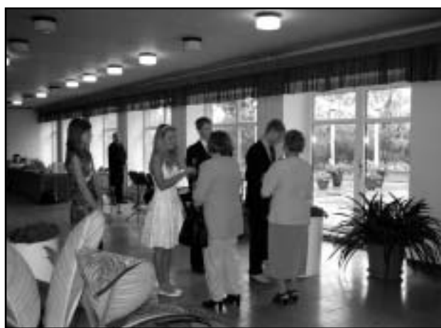
Igale õpetajale kingiti punane roos.