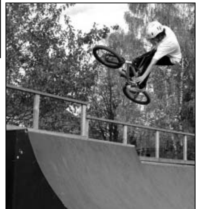
Mikk - quarterist air-tabletop.