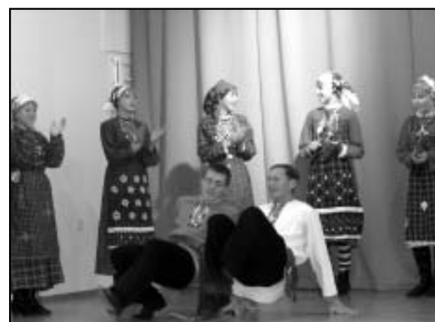
Esineb folklooriansambel Darali.