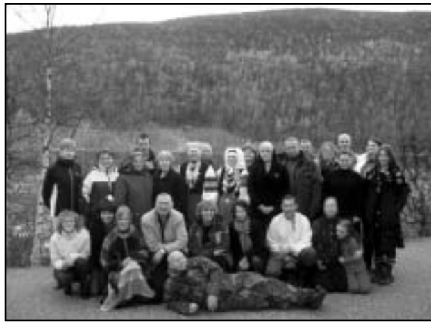
Reisieltskond Soome-Norra piiril, Teno jõe kaldal.

seotud taimede valmistamisega talveperioodiks. Seal on kollast, oranykaspunast ja sinipunast. Ruska kuldab maa tundrates. Seda ei ole võimalik mingi meediaga jäädvustada, seda peab ise nägema.