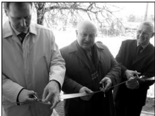
Endises postijaama kõrtsis on nüüd postkontor. Lk 2