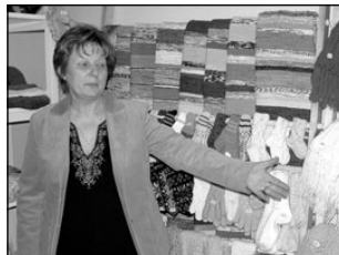
Elvas on taas aiapood. Lk 3