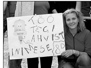
Gümnaasium kutsub kõiki elvalasi osalema maapäeval. Lk 4