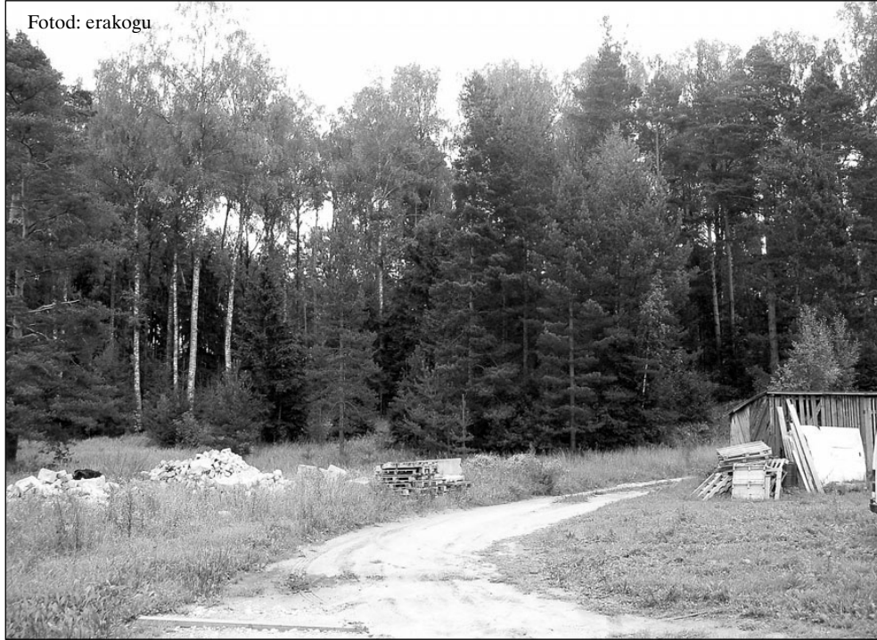
Metsapargi maa-alal hoitakse ehitusmaterjale, küttepuid ning omavõliliselt ehitatud kuurilobudikke.