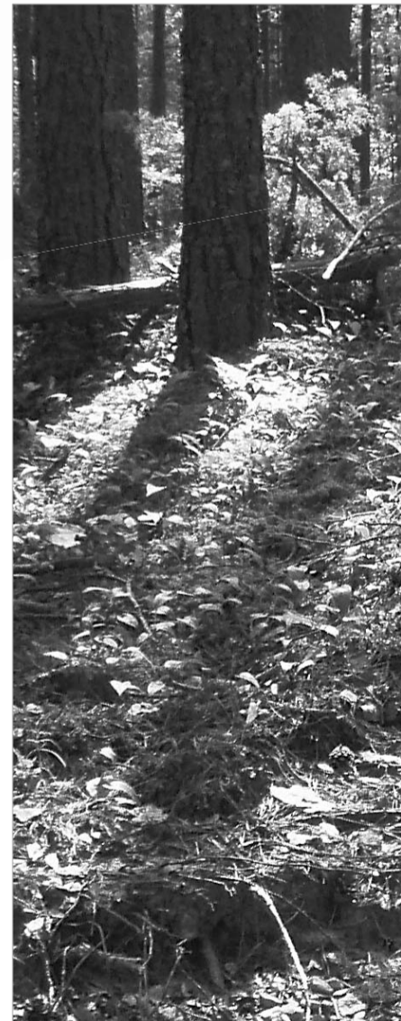
LÕHUTUD KÄÄBAS: Laossina külast suunduva tee ehitusega on lõhutud pikk-kääpa ots.

Peale käabaste leidub Kaguree liivastes männimetsades teisigi liivast kuhjasid, millele pole osatud veel rahuldavat seletust anda. Kuna Talka küla lähedal on neid kuhelike arheoloogiliselt kaevatud, tuntaksegi neid erialakirjanduses nn Talka tüüpi muististe nime all. 2007. aastal leidsime taolisi kuhjasid ja pikki madalaid liivavalle Lobotka ja Puugnitsa lähedastest metsadest ning Mustoja mõhnastiku metsamassiivis. Viimane leiukoht on eriti huvitav — nimelt läheb Veerhulitast Vaartsile viiv autotee otse läbi madala liivavalliga piiratud nelinurkse ala. Selle läbimõõt on 60 m ringis ning vall paistab olevat selgelt inimese poolt teht-