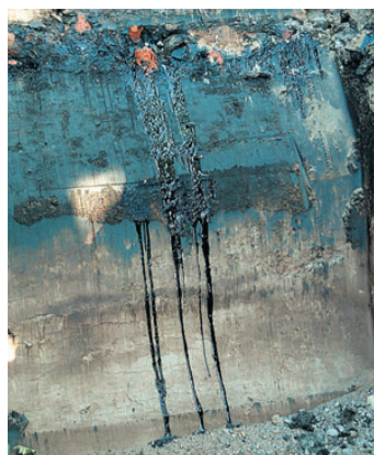
Kaevand tundmatu olluse niredega. Margus Ansu