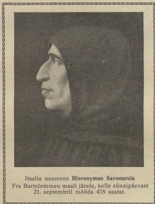
Itaalia usumees Hieronymus Savonarola Fra Bartolommeo maali järele, kelle sünnipäevast 21. septembril mööda 475 aastat.

Hirmus on patt — tema teeb inimese Jumala waenlaseks. Kuid ta on weel hirmsam, ta teeb ka Jumala inimese waenlaseks. Nii ütles kunagi Saamuel waesele Saulile: „Mispärast küsid sa minult, kui Jehoowa just on ära lahkunud ja on ju waenlane?“ (Saam. 28:16.) Jisraelist, sellest suurest walitsetud rahwast, kirjutab prohwet. „Uga nemad panid vastu, ja kurwastasid Püha Waimu; seepärast sai ta jälle neile waenlaseks, ta taples ise nende vastu“ (Jef. 63:9—10). See on põhjufeks, miks mitte ainult tulewikus Jumala wiha ei lange patustaja peale, waid kui tema ei ole otsinud ja