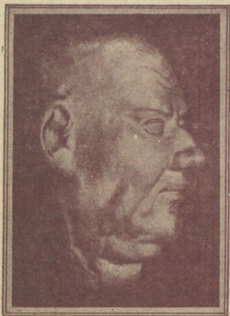
Lutheri surnu mask.

Lutheri surnumaski eest vaadates esineb meile lai nägu, nagu harilikult