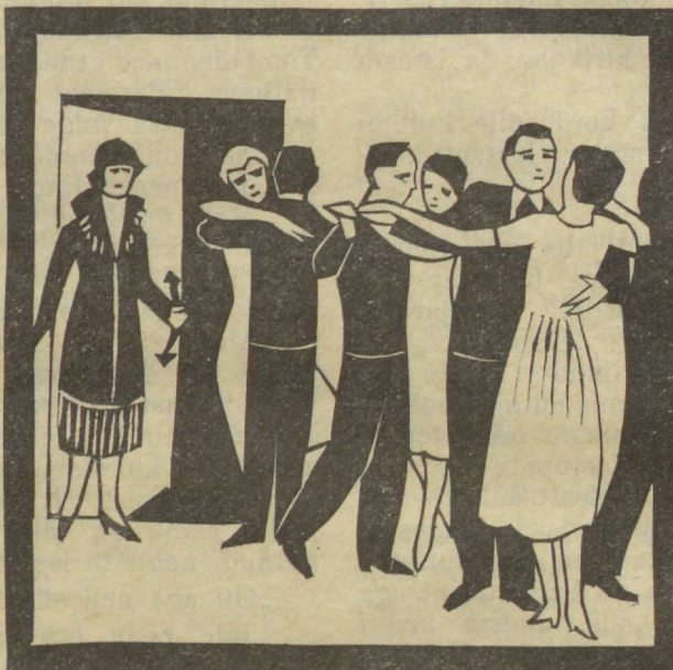
„Jumalaga!“ laususin ja kiirustasin välja.

Oli öö. Tõttasin koju poole, kuna hinges