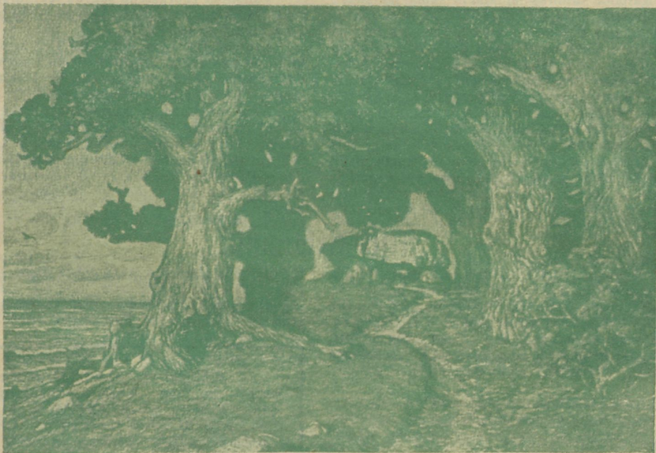
haud puude all.