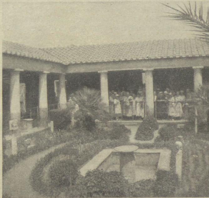
Wäljakaewatud Pompei linna maja seesmine ruum kordaseatuna.

„Misjugune imelik kokkujutamine! Kui rõõmsalt wõisite küll jällenagemises üksteist terwitada!“ (Järgn.)