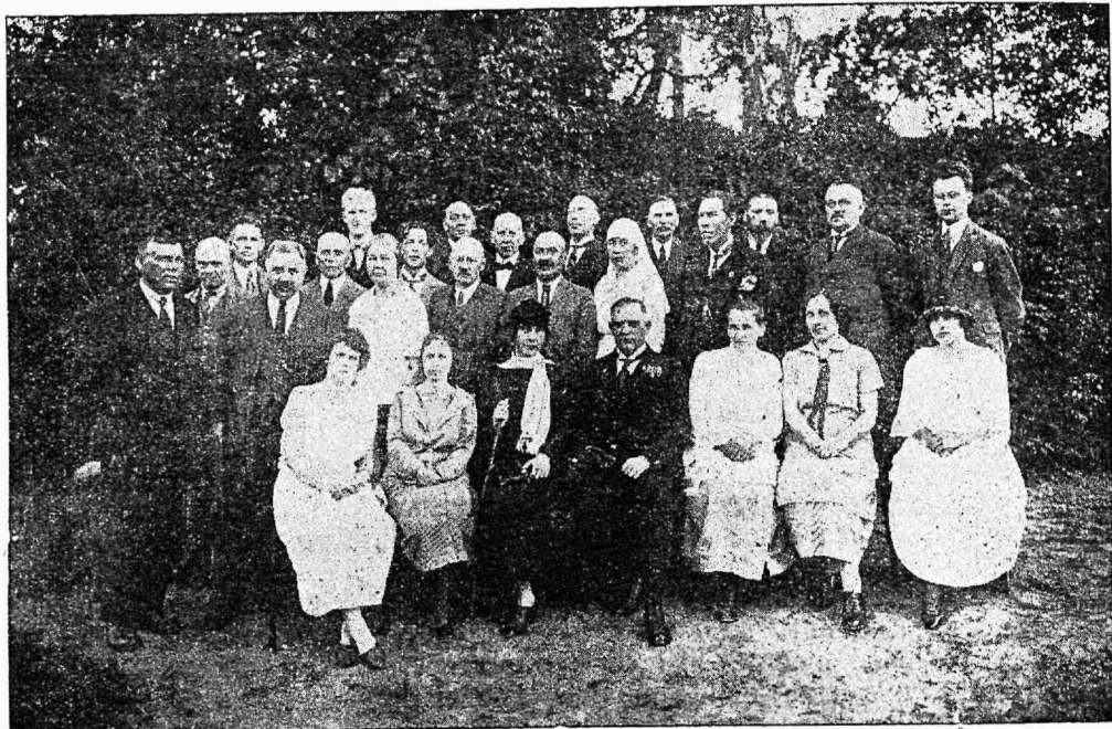
1925. a. juhatuse liikmed ja tegelased.

sõda rikas, kuid ka see jõukuse natukene, mis mustaks päevaks korjatud, valgus osalt varanduste, pankade, hoiu- ja pajukikassade evakueerimise teel Venesse, lõpulikult aga hääbusid nad Vene väärtpaberite ja rahamärkide väärtusetuks muutumise läbi. Need miljonid kuldrublad, mis rahulepingu põhjal Venelt saadi, ei katnud sajandit osagi sellest, mis Eesti kaotanud oli, kuid aitasid siiski kõige raskemast asumise ajast üle, ja kahklevalt jälgijad on tunnistama pidanud, et väike Eesti rahvas ka tühja kätega, oma kümne küüne abil, tahab ja võib oma riiklist ja sotsiaalset elu korraldada ja kindlustada.